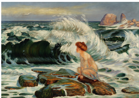
František Kupka (1871-1957) La vague, 1902 Huile sur toile, 100 x 145 cm Collection Galerie des beaux-arts d'Ostrava (GVUO)

Des peintres naturalistes, qui observèrent la vie des populations finistériennes, jusqu'aux surréalistes, qui en donnèrent une vision originale et poétique, ce sont près de 80 œuvres bretonnes d'artistes tchèques qui seront pour la première fois présentées en France. Alfons Mucha, Kupka et sa sublime Vague , la surréaliste Toyen... des rendez-vous exceptionnels à ne pas manquer !