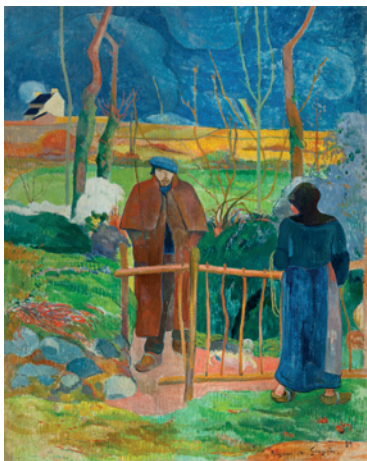
Paul Gauguin (1848-1903) Bonjour Monsieur Gauguin, 1889 Huile sur toile, 92.5 x 74 cm