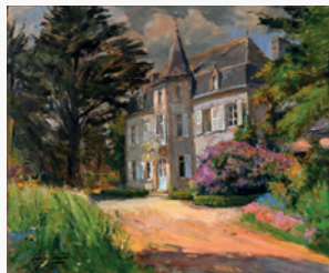
Émile Simon (1890–1976) Manoir de Squvidan © Collection Musée départemental breton, Quimper

Manoir de Squvidan Route de Squvidan 29950 Clohars-Fouesnant Tél. : 02 98 54 60 02