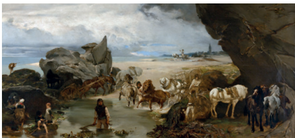
Jaroslav Čermák (Prague, 1831–Paris, 1878) La vie sur la côte près de Roscoff . Huile sur toile, après 1869, H. 78 x L. 164 cm © Galerie nationale de Prague