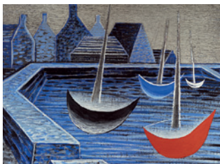
Jan Zrzavý (Okrouhice, 1890 – Prague, 1977) Bateaux dans un coucher de soleil bleu , 1934. © Galerie nationale de Prague

Samedi 23 juin à 15h Gratuit / e-réservation sur le site du musée des beaux-arts RDV au musée des beaux-arts