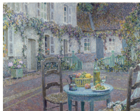
Henri Le Sidaner (1862-1939). La table bleue, Gerberoy. Huile sur toile. 1923. Singer Museum.

Auditorium de la Maison du département 32, boulevard Duplex - Quimper