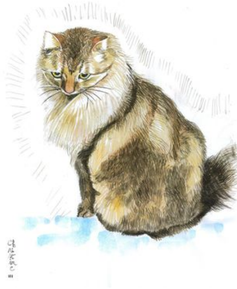
^ Chatte Griez Etape 2