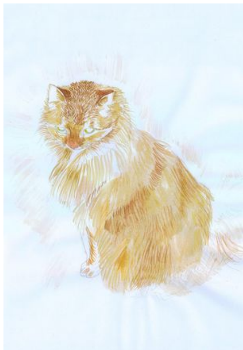
^ Chatte Griez Etape 1

8/ Replier sur le dessous le haut de votre feuille blanche. Passer une ficelle près de la pliure. Fermer le pli avec le scotch. Nouer la ficelle pour accrocher votre suspension.