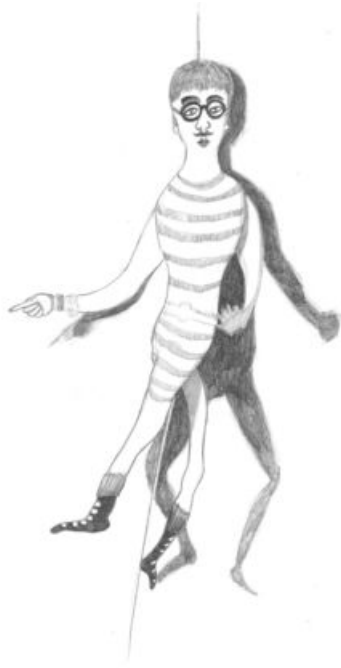
^ Copie du pantin Foujita