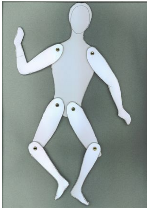
^ Pantin vu de face