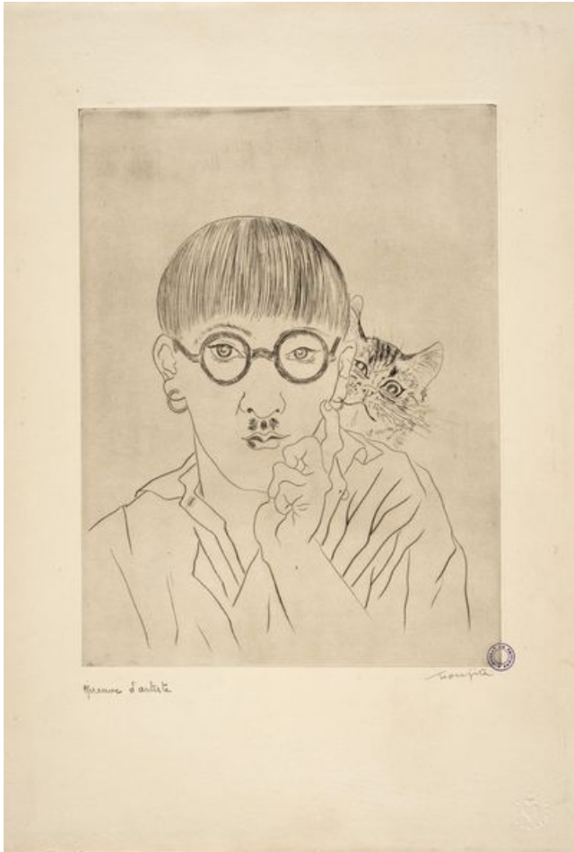
^ Léonard Tsuguharu Foujita (1886-1968) - Autoportrait au chat, 1926-1927 - Burin sur papier, 50,5 x 35 cm - Collection des musées de Poitiers

L'exposition en cours du musée est dédiée à "L'Amour fou ? Intimité et création (1910-1940)" et présente dix couples d'artistes.