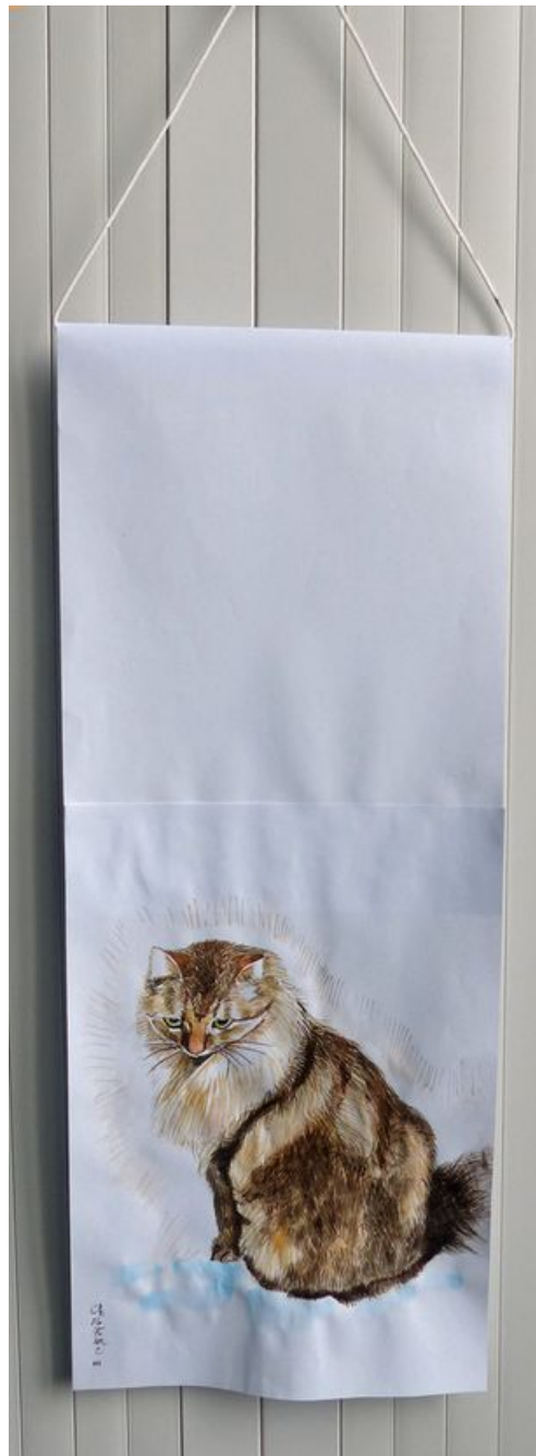
^ Résultat façon kakémono

◀ Activité couleurs : N'est pas Picasso qui veut !