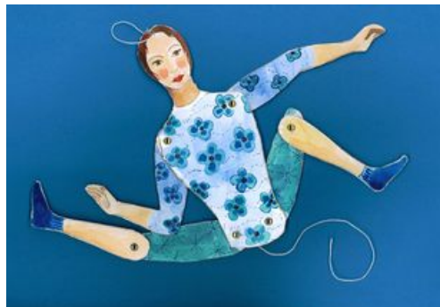
^ Autoportrait en posture yoga