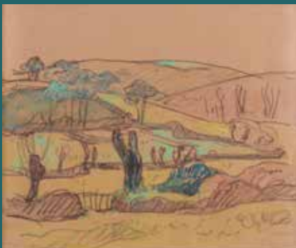
Gourlizon, 4 e quart du XIX e siècle - 1 er quart du XX e siècle, aquarelle, collection particulière

La palette des activités va du livret-jeu pour accompagner les familles, aux visites pour les personnes curieuses de découvrir l'œuvre en compagnie d'un guide, en passant par des ateliers pour les enfants ayant une âme de créateurs. Inscrivez-vous !