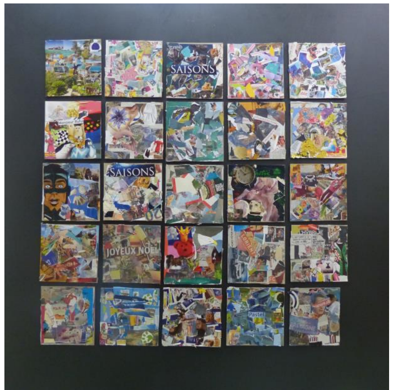
Réalisation finale : un collage par classe