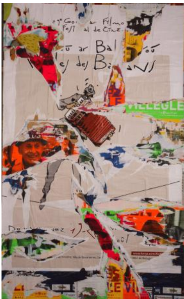
Jacques Villeglé (né en 1926) Rue Chaptal , 18 août 2006 Affiches collées et lacérées, 193 x 119 cm Musée des beaux-arts de Quimper

Séance atelier 3 : images et couleurs déchirées dans des magazines. Réalisation d'une composition colorée abstraite avec quelques motifs figuratifs et des écritures.