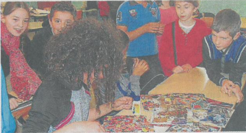
Les élèves de CM2 devant leurs collages.

Ce vendredi, les élèves de CM2 de la classe de Laetitia Le Monnier achevaient un cycle de six séances d'un projet proposé par le musée des beaux-arts et la maison du patrimoine, par un collage inspiré de l'œuvre de l'artiste quimpérois Jacques Villeglé.