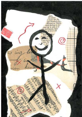
Exemple de travaux d'élèves