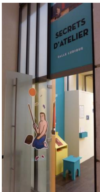
Entrée de la salle Secrets d'atelier « Le Journal des collections »

Du 6 novembre 2015 à mi-mars 2016 Secrets d'atelier : Le Journal des collections