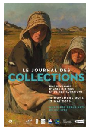
Affiche de l'exposition

Permis de toucher ! « Secrets d'atelier » propose jeux et manipulations (sans se salir !) pour découvrir la démarche d'artistes en prolongement de l'exposition.