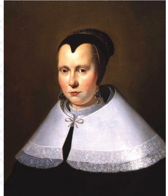
Anonyme, école hollandaise Portrait de femme à la collerette, 1643 Huile sur toile, 70.5 x 55 cm