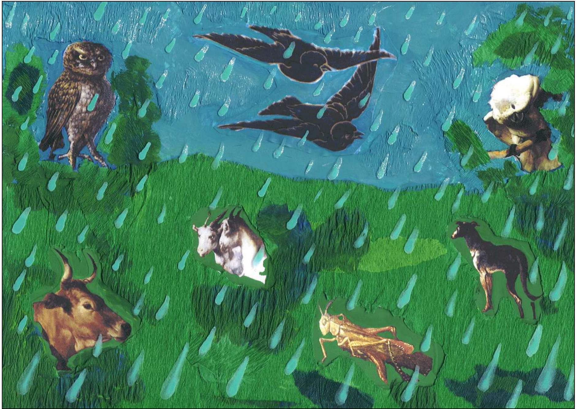
Au 40 e jour de pluie, on vit les animaux se rassembler dans une prairie près du bateau de Noé .