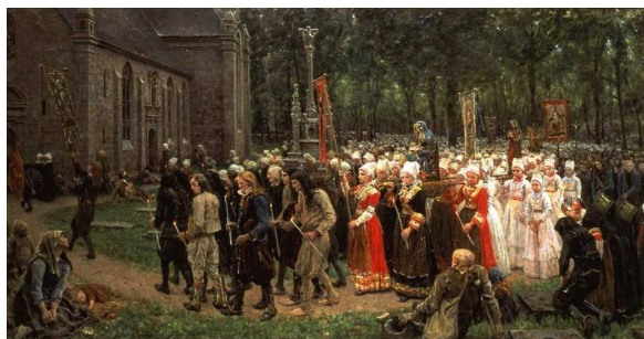
Jules Breton Le Pardon de Kergoat , 1891