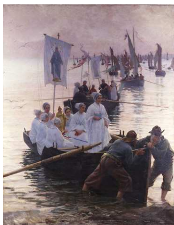
Alfred Guillou L'arrivée du pardon de Sainte-Anne-de-Fouesnant à Concarneau , 1887