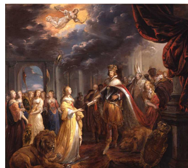
Theodor van Thulden (1606-1669) Le Roi d'Espagne accordant la paix aux sept Provinces-Unies des Pays-Bas , vers 1650 1er étage—peinture flamande du 17eS—salle 5