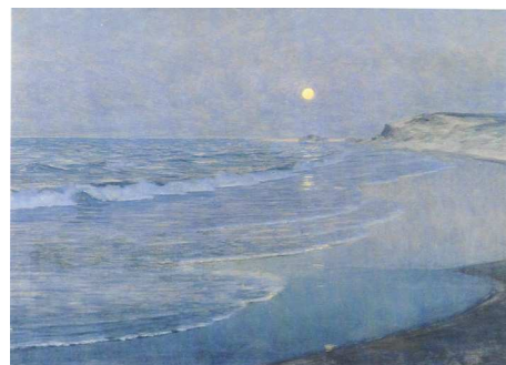
Thomas-Alexander Harrison (1853-1930) Marine, clair de lune , 1892-1893 1er étage—peinture française du 19eS—salle 19