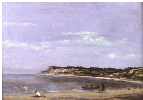
Eugène Boudin (1824-1898) Marine, rivage normand , 1856 1er étage—peinture française du 19eS—salle 18