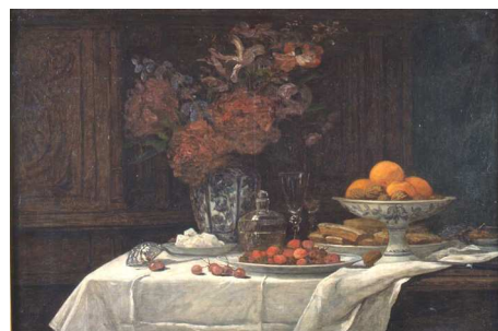
Eugène Boudin (1824-1898) Nature morte aux fruits , vers 1856-1860 1er étage—peinture française du 19eS—salle 18

Les enfants attrapent les cerises, les mangent, gardent les noyaux dans les mains, poings fermés.