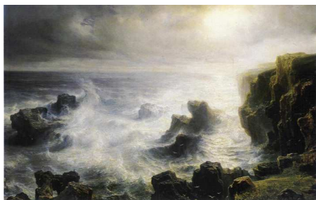
Théodore de Gudin (1802-1880) Tempête sur les côtes de Belle-Ile , 1851 1er étage—peinture française du 19eS—salle 18

5- Les enfants recherchent une falaise pour cracher les noyaux.