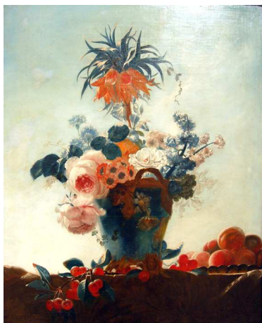
Jean-Jacques Bachelier (1724-1806) Un Vase avec des fleurs , vers 1750-1755 1er étage—peinture française du 18eS—salle 12