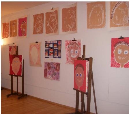
Exemple d'exposition de travaux d'élèves organisée par le service éducatif