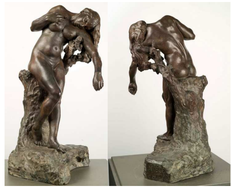
Camille Claudel (1864-1943), Niobide blessée, 1906 Musée Sainte-Croix de Poitiers

Les enfants ont à leur disposition quatre vues (face, profils et dos) de Niobide blessée de Camille Claudel. Ils remettent dans l'ordre les vues sur une colonne pour restituer le volume de la sculpture.