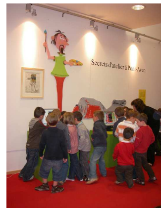
Secrets d'atelier : Paul Gauguin printemps 2009