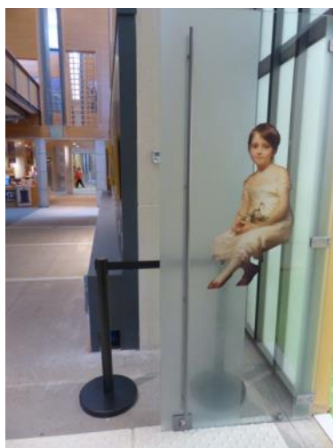
Entrée de la salle Secrets d'atelier

Les enfants font face à deux paysages composés de manière traditionnelle : ils sont découpés en plans qui se succèdent, du plus proche au plus lointain, pour créer un effet de profondeur : la perspective. Ils reconstituent la maquette en glissant quatre plans découpés dans l'ordre en commençant de préférence par le fond.