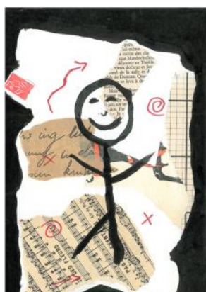
Exemple de travaux d'élèves