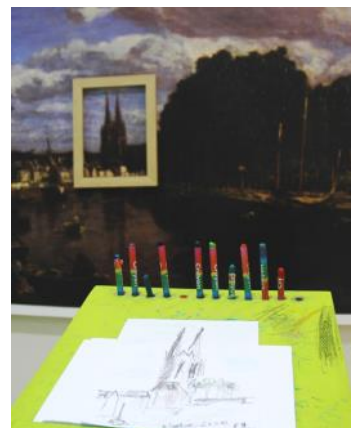
Secrets d'atelier : la Bretagne des peintres

« Secrets d'atelier » propose jeux et manipulations (sans se salir !) pour découvrir la démarche d'artistes en prolongement de l'exposition.