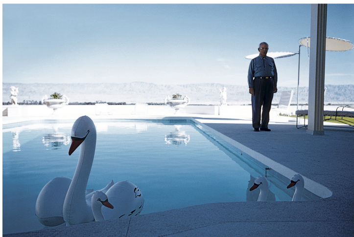
Robert Doisneau (1912-1994) Les Cygnes gonflables, Palm Springs, 1960 81 x 120 cm

En lien avec la section de l'exposition temporaire du musée « Robert Doisneau, l'œil malicieux » (16 novembre-15 avril) consacrée aux photographies de Palm Springs de 1960, ce cycle intervient afin de camper et expliciter cet âge d'or de l'après-guerre aux USA, ce rêve californien ensoleillé qui a fasciné et tant attiré, et incarna si bien l' American Dream côte Ouest.