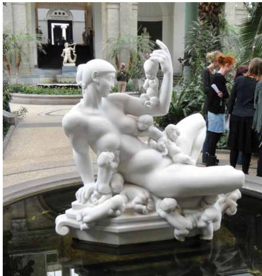
La «Glyptothèque Carlsberg», un musée avec son jardin d'hiver subtropical où trône au milieu d'un bassin une statue féminine de marbre blanc, à Copenhague.

C'est maintenant la «Glyptothèque Carlsberg» un musée avec son jardin d'hiver subtropical où trône au milieu d'un bassin une statue féminine de marbre blanc, la symbolique de l'année, sur laquelle sont appuyés douze bambins délicieux à la mine plus ou moins réjouie.