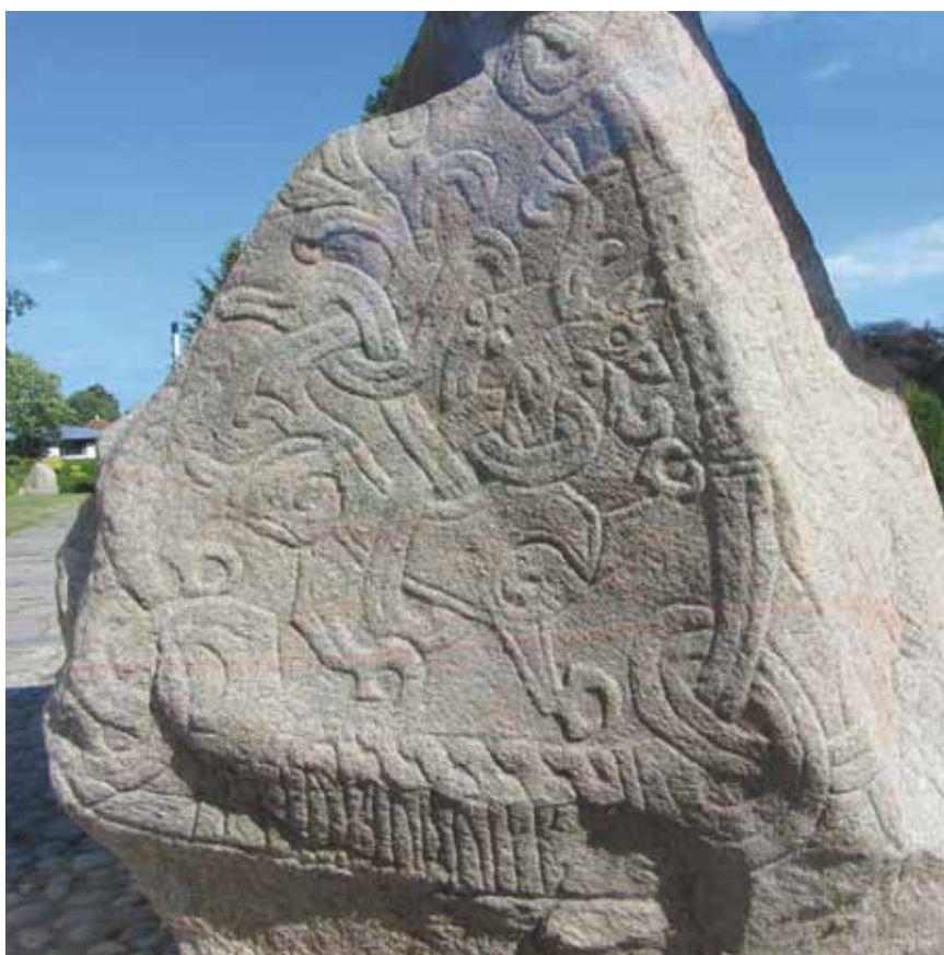
Pierre runique du roi Harald, Jelling, Danemark.