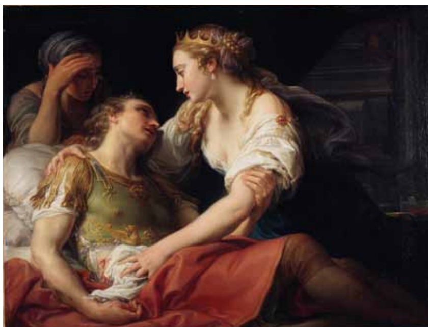
La mort de Marc-Antoine , Pompeo Batoni, huile sur toile, 1763. ©Musée des Beaux-Arts de Brest métropole.

Visite d'une belle exposition : de la découverte, de talents, servie par une scénographie imaginative et performante.