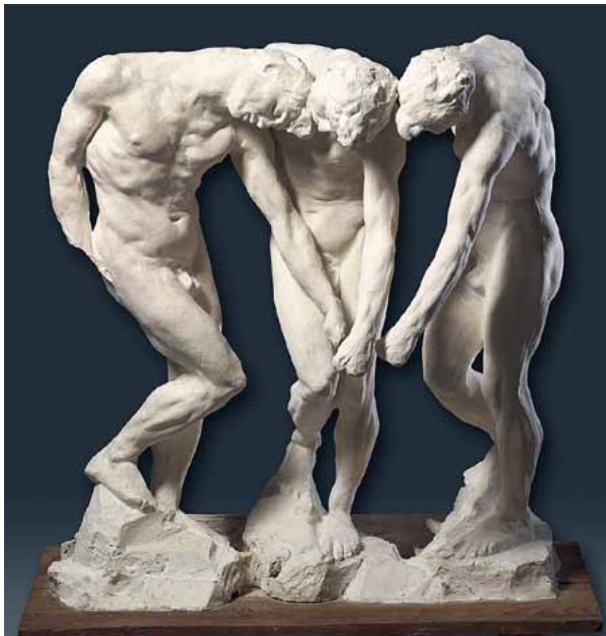
Auguste Rodin (1840-1917) Les Ombres vers 1885. Plâtre d'atelier, avant 1909. H 97 x L 92 x P 40 cm. Musée des Beaux-Arts de Quimper. Dépôt du Fonds national d'art contemporain, Paris.