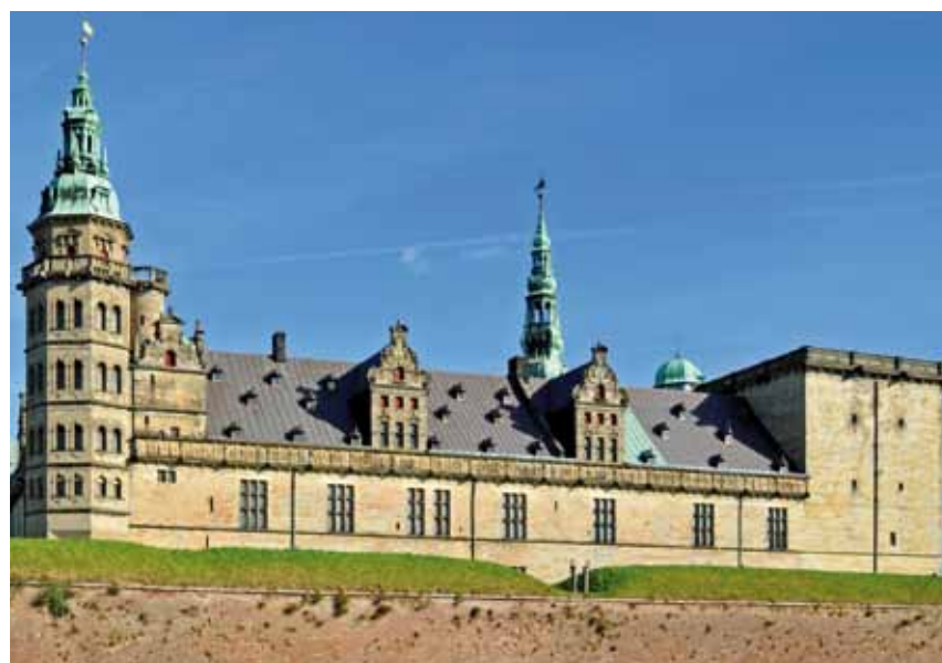
Château de Kronborg, Danemark.