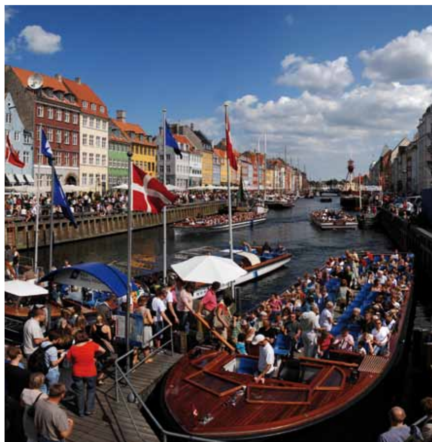
Foule assemblée dans Le vieux port Nyhavn, Danemark.