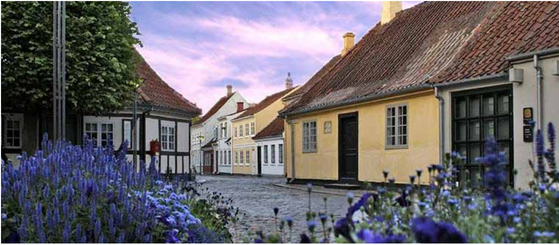
Maison de Chris Hans Andersen à Odense.