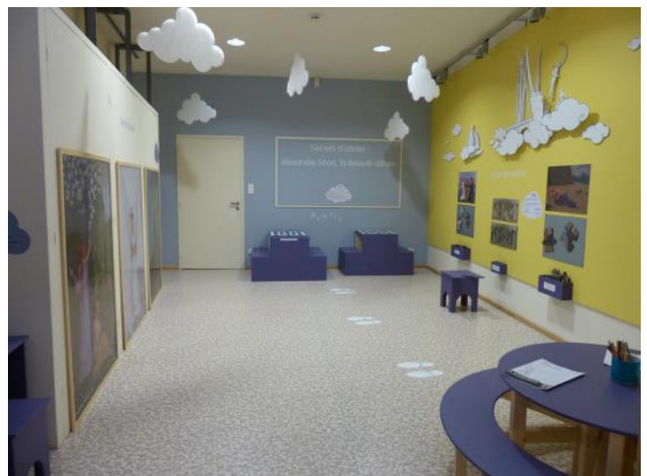
Vue de la salle