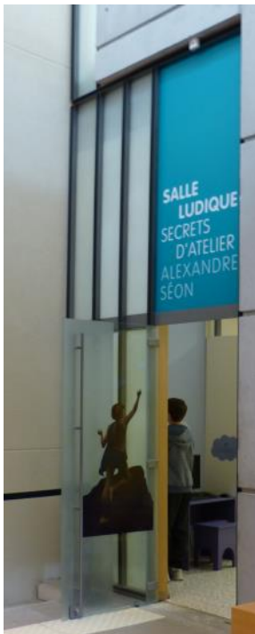
Entrée de la salle Secrets d'atelier « Alexandre Séon, la Beauté idéale »

Permis de toucher ! Ces « Secrets d'atelier » version 2015 familiarisent le jeune public avec les œuvres d'Alexandre Séon et le symbolisme. Ils ont été conçus d'après l'exposition temporaire « Alexandre Séon, la Beauté idéale ».