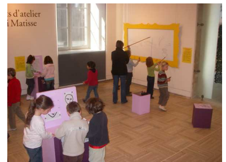
« Secrets d'atelier » : Henri Matisse, au fil de la ligne , printemps 2008

Les premiers « Secrets d'atelier » accompagnaient l'exposition des estampes d'Henri Matisse en 2008. Les seconds portaient sur « Paul Gauguin, La Vision du sermon » au printemps 2009. Le succès a été au rendez-vous.