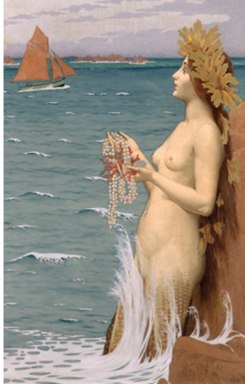
→ Alexandre Séon, La Sirène