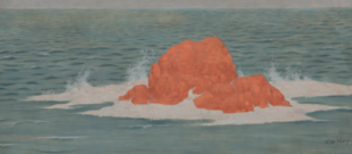
↑ Alexandre Séon, La Mer, la houle, vers 1903