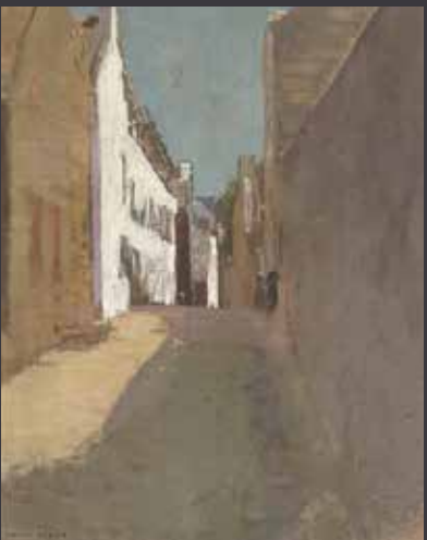
Rue à Douarnenez , 1875, Huile sur toile

Il semble que ce soit peu après les combats de la guerre de 1870 qu’Odilon Redon ait eu un premier contact avec la Bretagne. L’impression en est suffisamment forte pour qu’il décide d’y revenir à au moins trois reprises, en 1875, 1880 et 1883. L’important corpus d’œuvres décrivant les côtes armoricaines souligne la place essentielle qu’occupent ces paysages marins dans sa quête de sujets inconnus. Odilon Redon s’est essentiellement intéressé aux rivages du Finistère, entre Douarnenez et la presqu’île de Crozon. A un moment où la Bretagne commence à devenir une destination populaire, Redon fuit la compagnie des autres artistes, tout comme il se désintéresse des riches traditions locales. Ses recherches se reportent vers les paysages où affleurent les éléments d’une nature primitive. Et quand il se passionne pour une vue urbaine, comme à Douarnenez, c’est pour mieux en extraire l’insolite poésie infusant de murs banals. L’ensemble breton de Redon est remarquable en ce qu’il démontre l’acuité d’un regard qui surmonte certaines facilités de la peinture de genre : ses paysages sont laissés aux confins du rêve et nous transportent parfois dans un temps aboli.