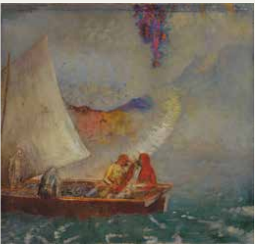
La Voile grise , s. d. Huile sur toile Collection particulière

La renommée d’Odilon Redon repose aujourd’hui sur la fascination qu’exercent nombre de ses compositions étranges qui développent des mondes irréels et souvent fantastiques. Les œuvres savantes, fréquemment imprégnées de références littéraires ou irriguées par les mythes et la religion, ont consacré l’originalité d’un créateur immense dont on a fêté, en 2016, le centenaire de la disparition. Cependant, la reconnaissance et la diffusion de cet art visionnaire ont occulté d’autres aspects, sans doute plus secrets de son œuvre. Ainsi, on connaît peu les nombreux paysages qu’il a dessinés ou peints durant toute sa vie et qui composent un ensemble passionnant à bien des égards. Car ce sont aussi ces œuvres qui éclairent de façon pénétrante les multiples facettes de son environnement intime.