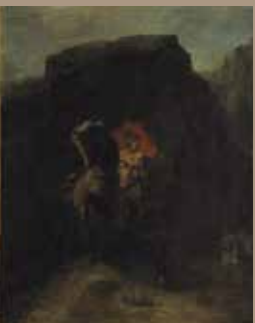
Roland à Roncevaux , 1862 Huile sur toile

Fidèle à la tradition romantique exaltant la montagne et faisant du voyage dans les Pyrénées une expérience initiatique, l’artiste y séjourne à quatre reprises, entre 1862 et 1878. Ses pérégrinations le conduisent jusqu’à Pampelune et jusqu’aux plateaux désertiques de la Biscaye espagnole, en passant par la pittoresque cité médiévale de Saint-Jean-Pied-de-Port et les sites mythiques de Gavarnie et de Roncevaux, encore hantés par le souvenir du valeureux Roland. Les “pics étincelants” de la vallée d’Ossau lui révèlent un “monde féérique” et le sentiment du sublime. Dans ce pays des grands horizons et des mornes solitudes, l’artiste poursuit l’expérience de l’incommensurable immensité.