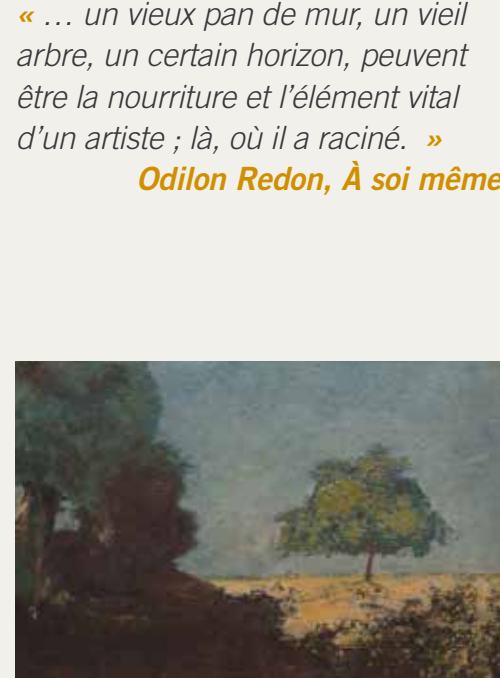
Décor pour le château de Domecy : Arbre, fond jaune, 1901 Huile, détrempe, fusain et pastel sur toile Paris, musée d'Orsay

Le motif de l'arbre traverse toute la carrière d'Odilon Redon. Réalisé au crayon, au fusain, au pastel ou à l'huile, ce sujet semble concentrer les interrogations esthétiques de l'artiste. Comme un trait d'union entre le réel et l'art, l'arbre constitue la racine de Redon dans l'art de la représentation. Frappé par l'acuité des dessins de Camille Corot, Redon suivit son conseil : "Allez tous les ans peindre au même endroit ; copiez le même arbre". Les études d'arbres forment un important corpus. Les dessins exécutés au crayon graphite, d'un trait fin et précis, s'attardent à délimiter de manière concise un tronc, l'embranchement des ramifications, quelquefois les feuilles, l'écorce ou le cône d'une