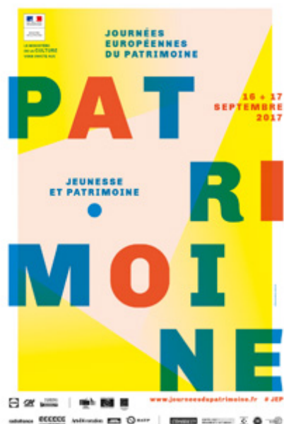
Visuel des Journées européennes du patrimoine