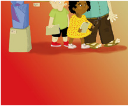
Enquête familiale "Le conservateur, dans la réserve, avec le chevalet"