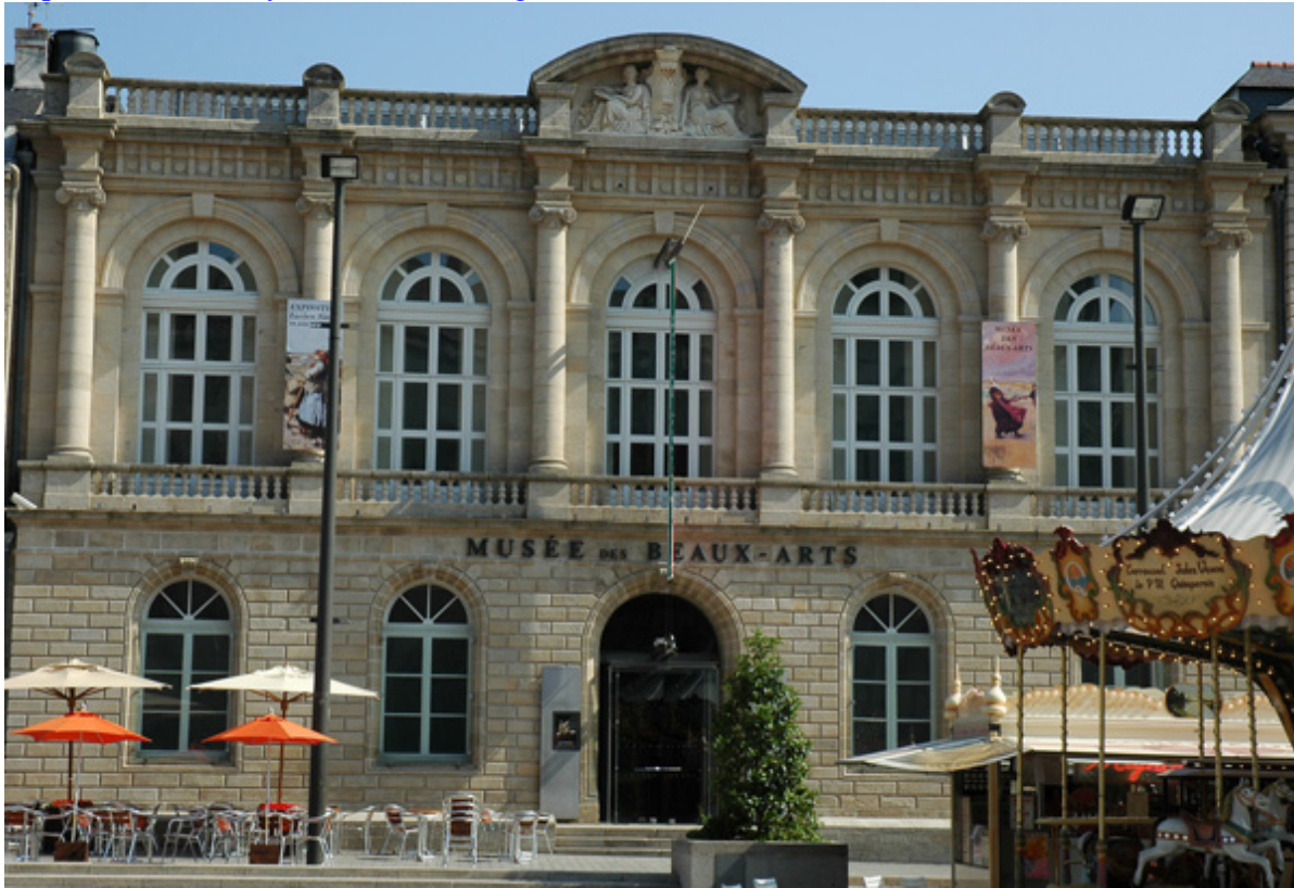
Façade du musée, place Saint-Corentin