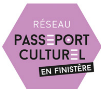
logo du réseau "passeport culturel en Finistère"