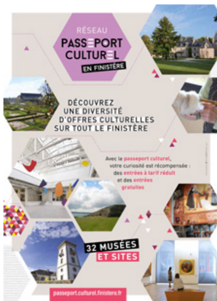
Passeport culturel en Finistère