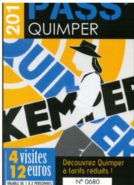
Pass' Quimper 2017