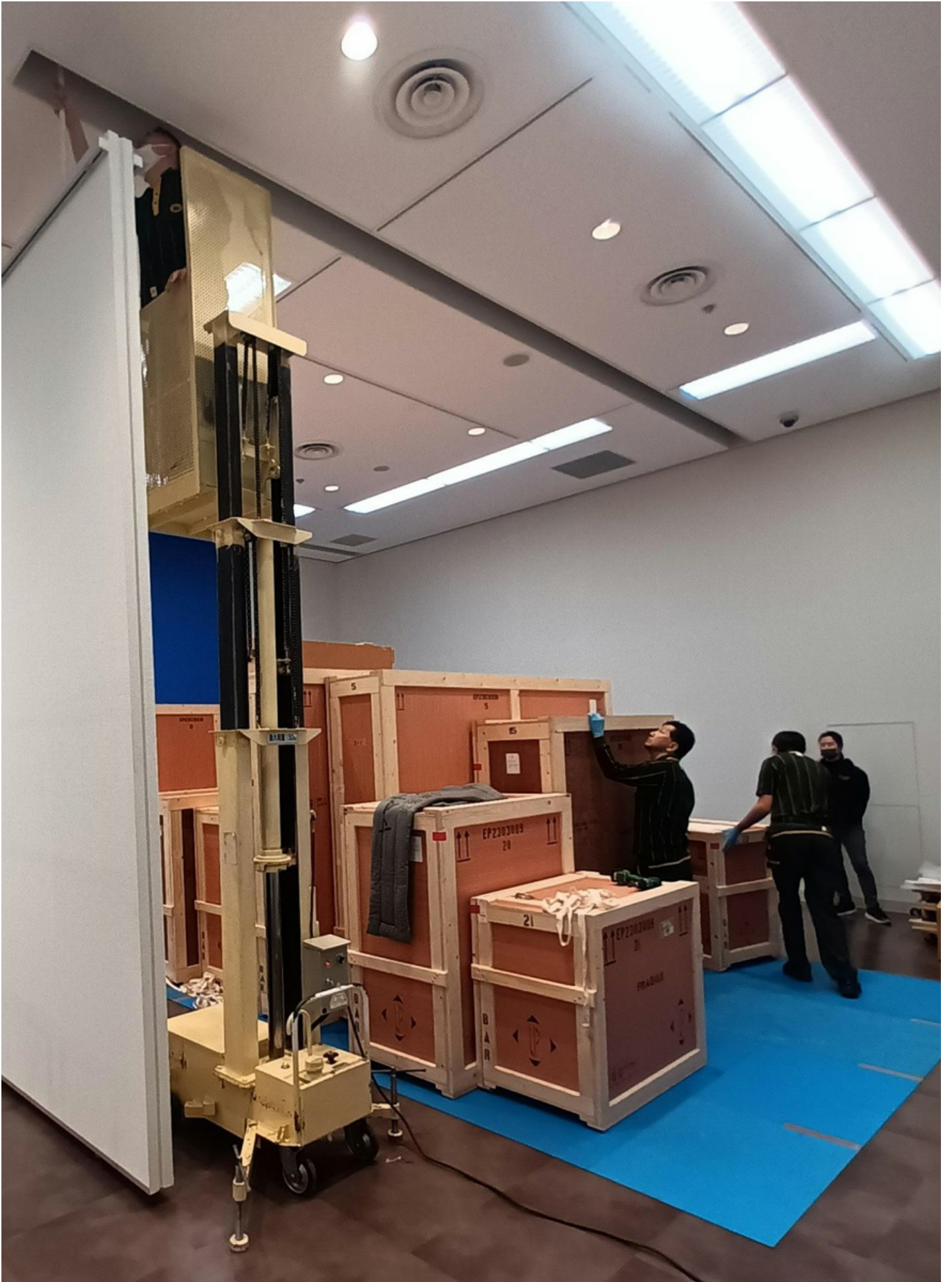
Image 12 sur 32 Caisses des œuvres quimpéroises à Toyohashi