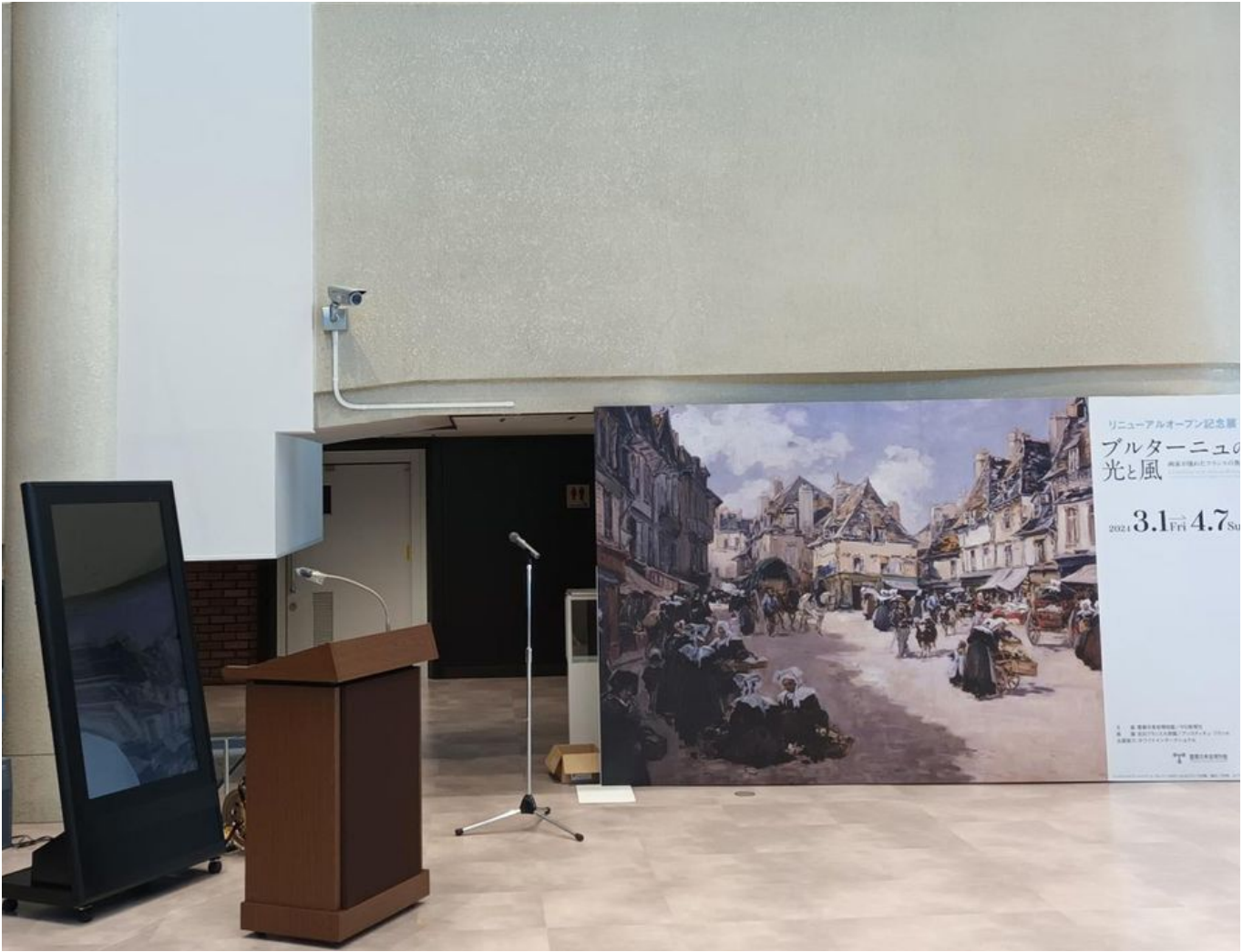
Image 11 sur 32 Préparatifs du vernissage avec l'affiche de Le Gout-Gérard