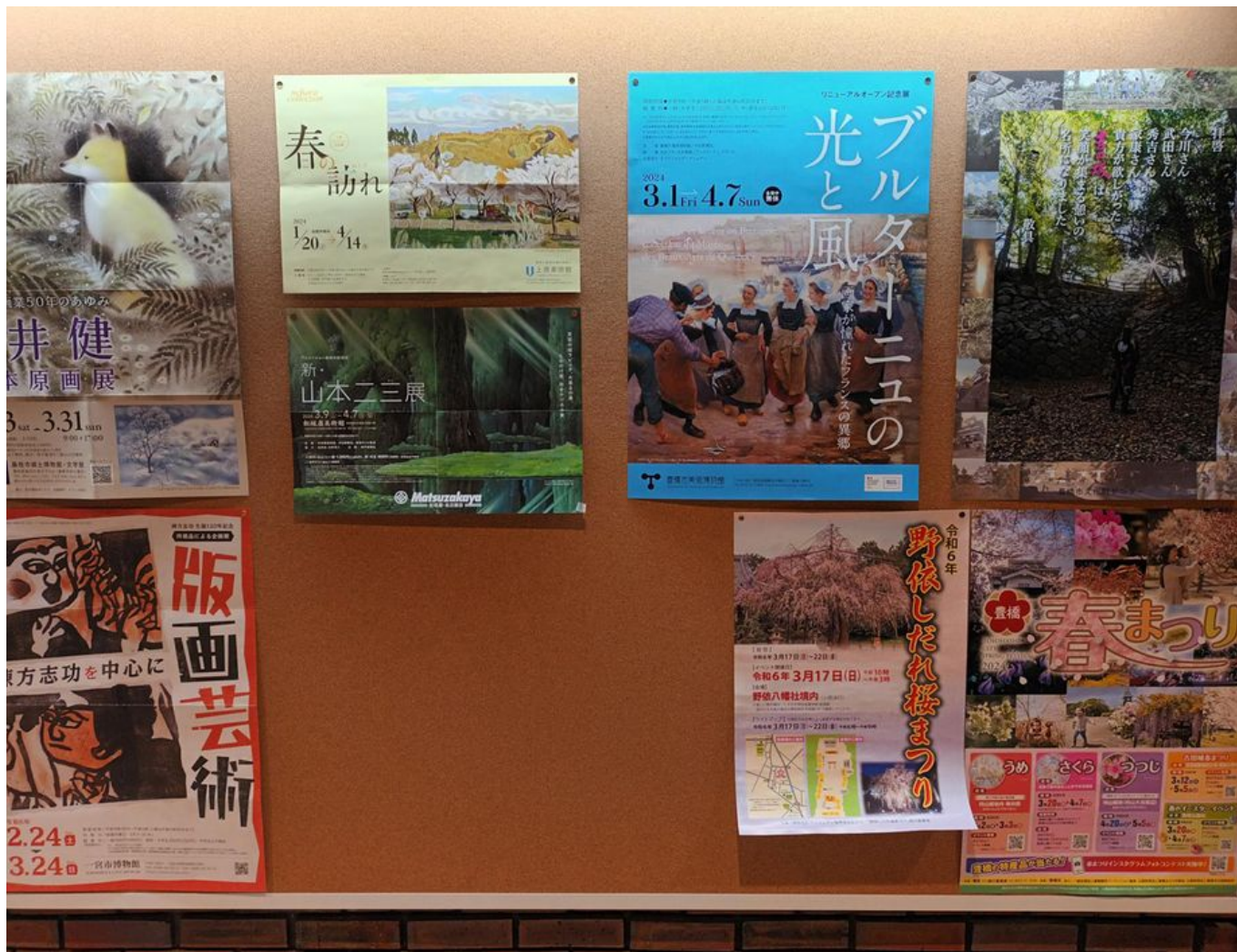
Image 9 sur 32 Affiche de l'exposition quimpéroise à Toyohashi