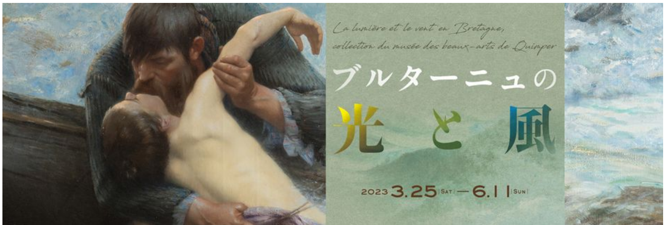
^ Affiche de l'exposition des œuvres du musée au Japon

63 œuvres du musée sont parties pour le Japon ! Elles forment l'exposition "La lumière et le vent en Bretagne". Du 25 mars 2023 au 2 juin 2024, son itinérance la mènera en 5 musées.