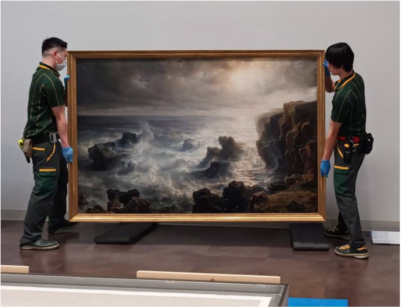
Image 16 sur 32 Accrochage du Gudin à Toyohashi