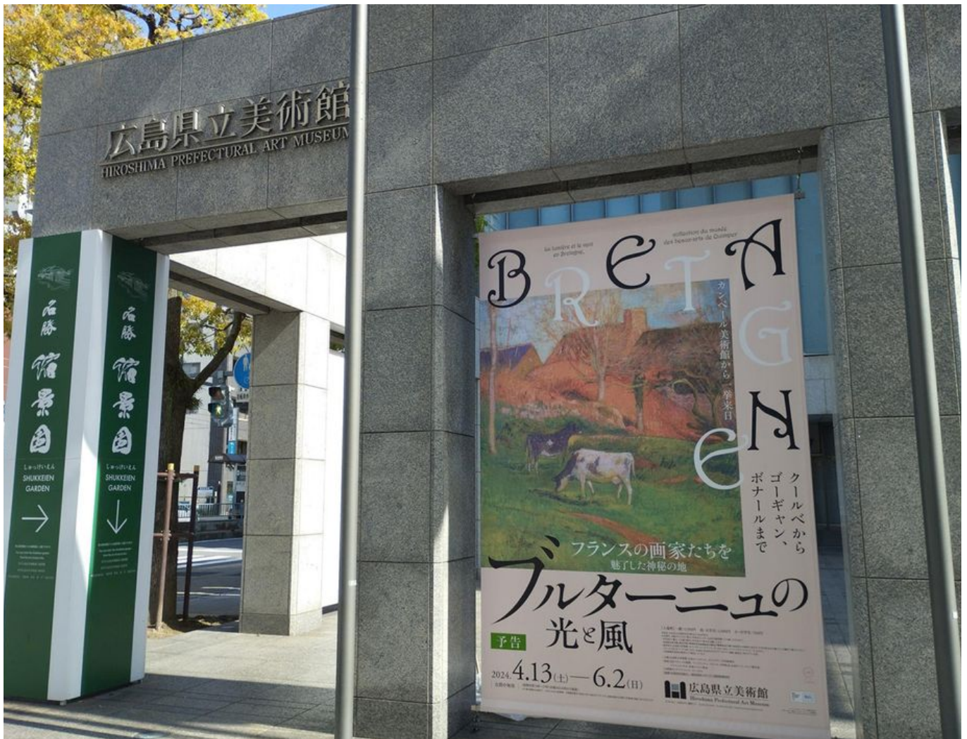
Image 1 sur 32 Affiche de l'exposition à Hiroshima