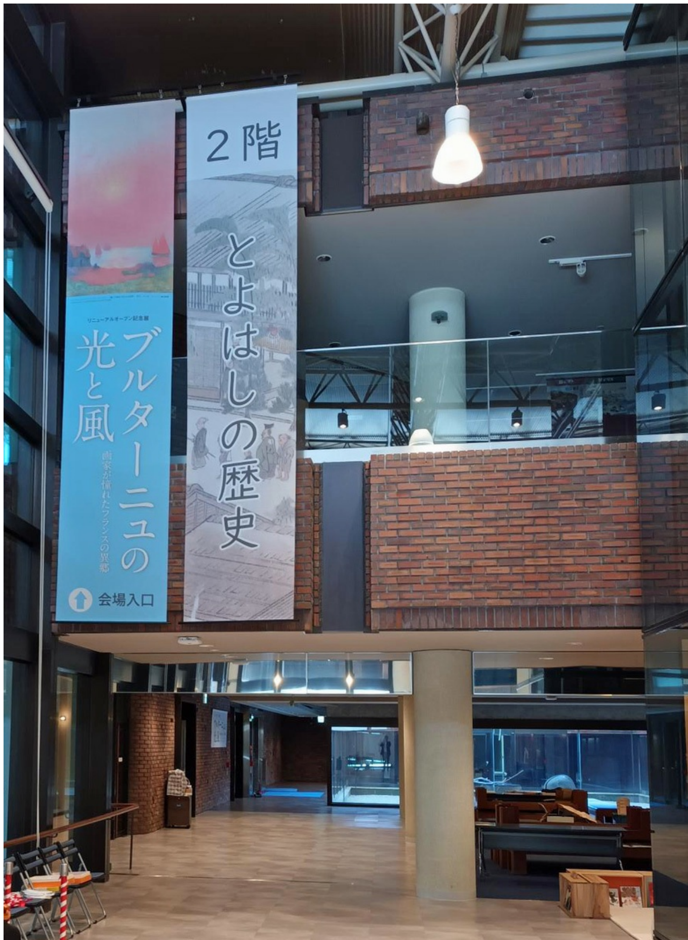
Image 10 sur 32 Kakemono de l'exposition quimpéroise à Toyohashi