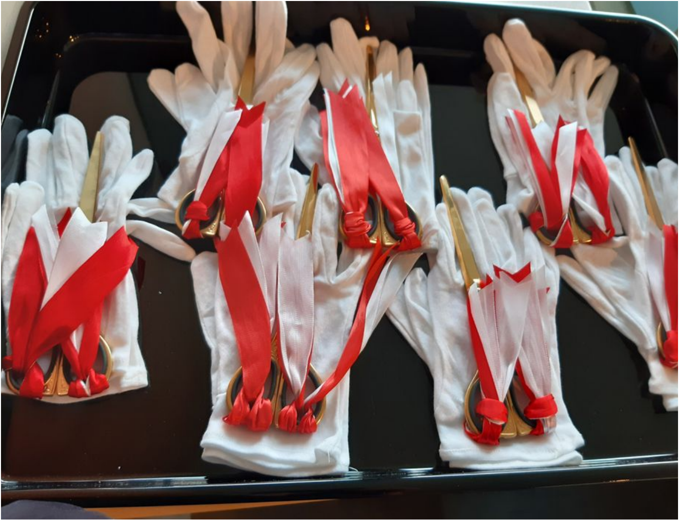
Image 6 sur 32 Matériel d'inauguration à Hiroshima