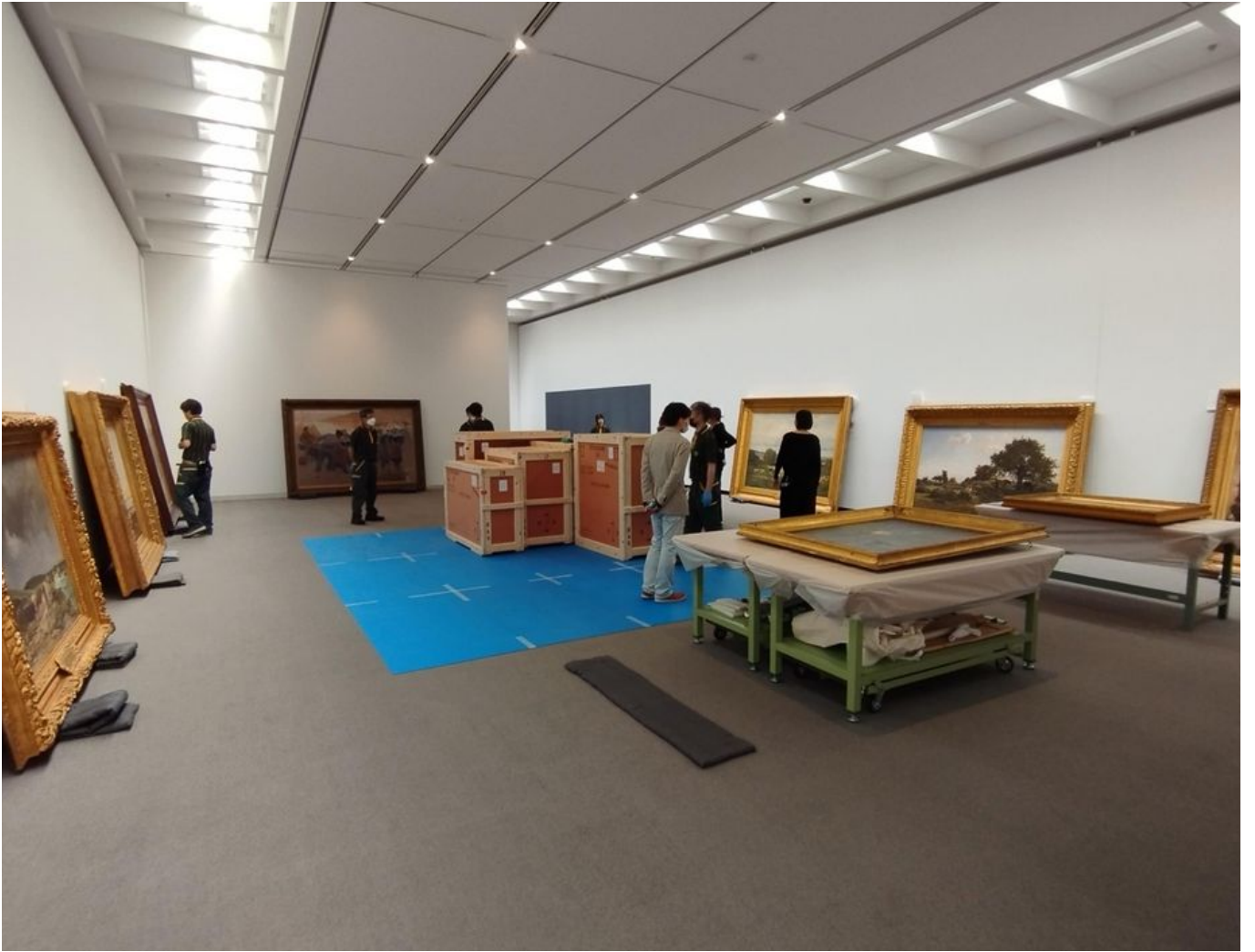
Image 5 sur 32 Accrochage à Hiroshima