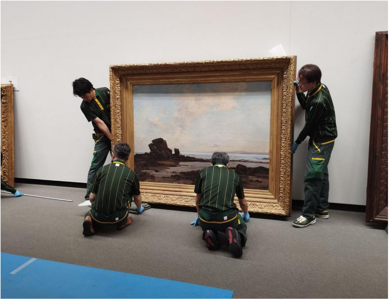
Image 3 sur 32 Accrochage à Hiroshima