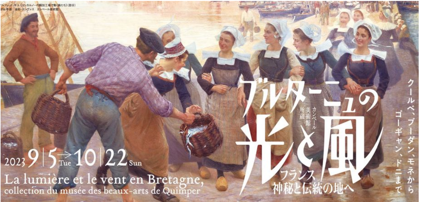
Image 17 sur 32 Affiche de l'exposition au Shizuoka City museum