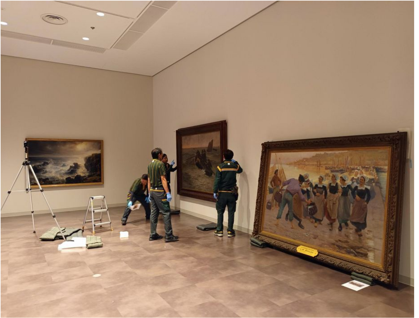
Image 13 sur 32 Accrochage à Toyohashi