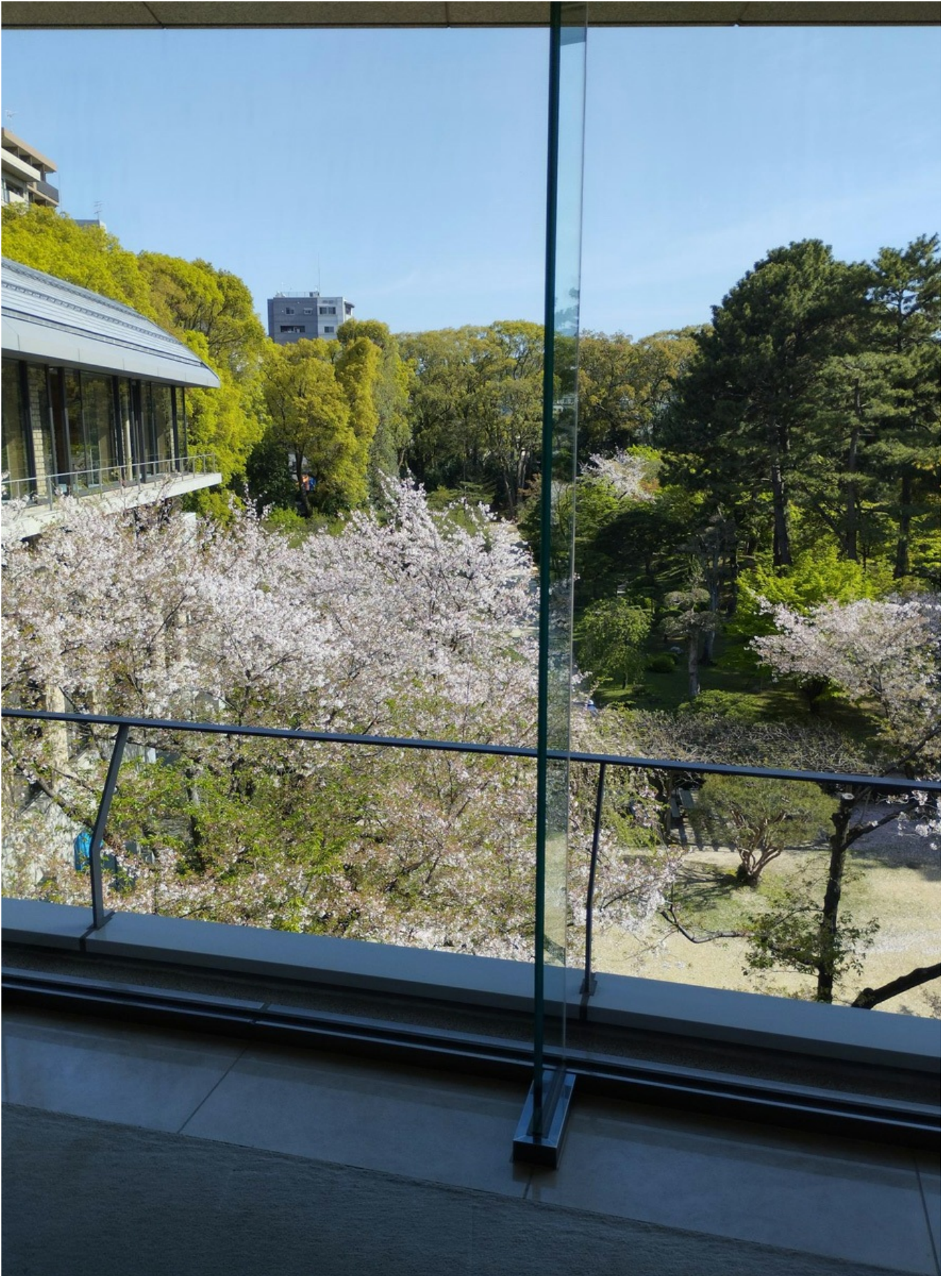
Image 2 sur 32 Le musée et son parc fleuri à Hiroshima