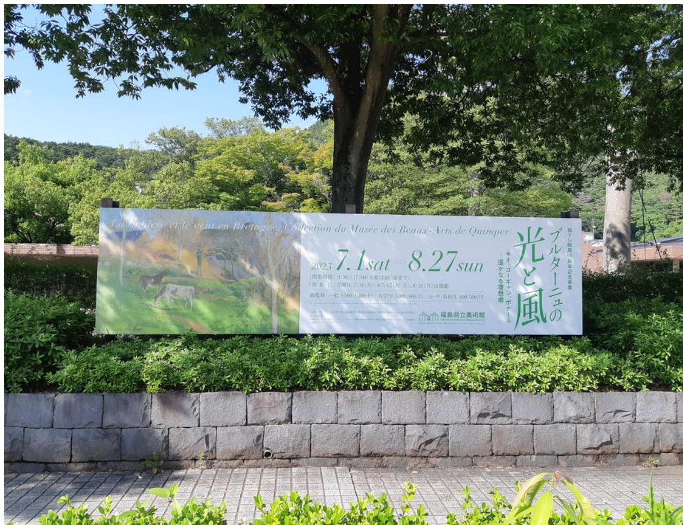
Image 18 sur 32 Affiche de l'exposition à Fukushima