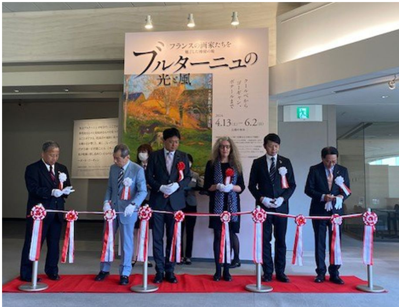
Image 7 sur 32 Inauguration à Hiroshima