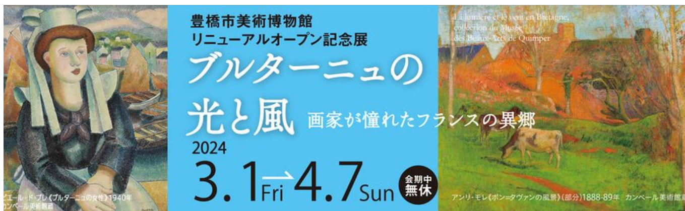
Image 8 sur 32 Bannière de l'exposition à Toyohashi