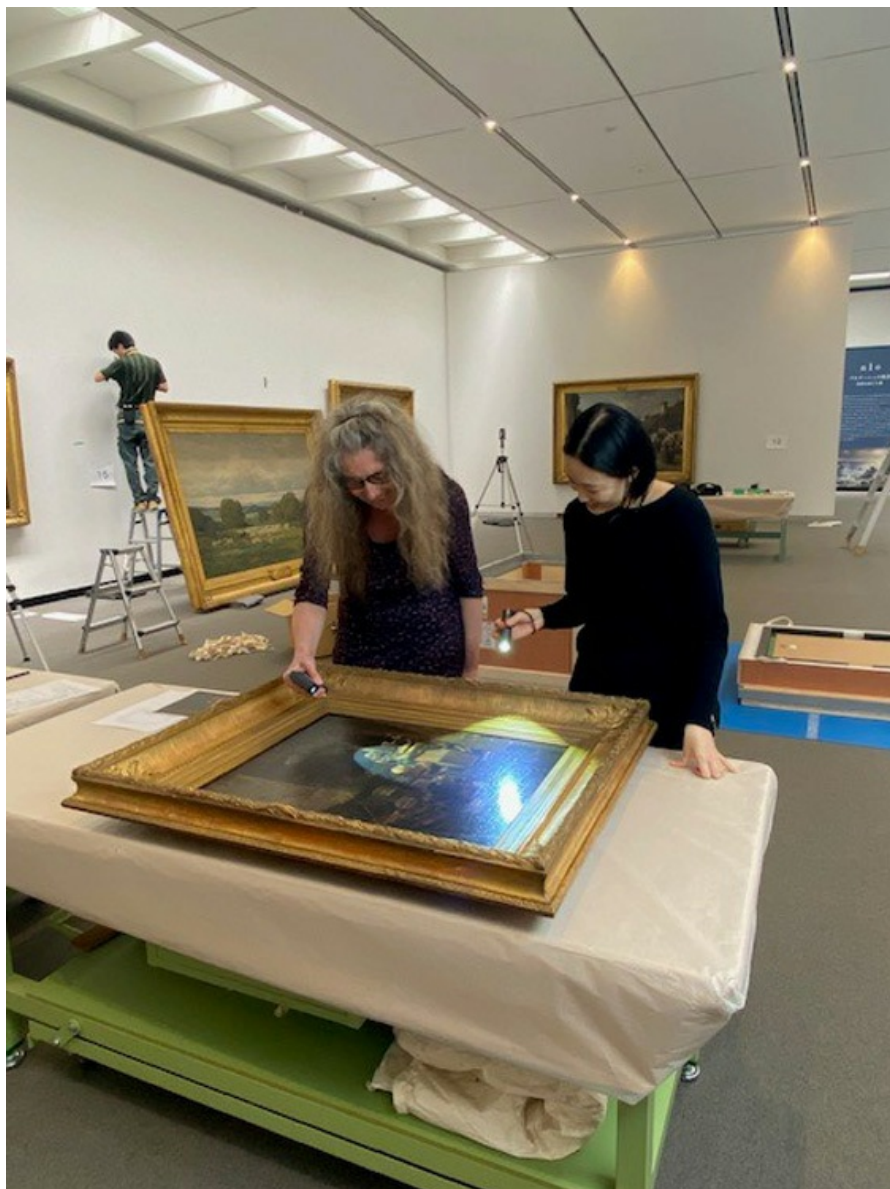
Image 4 sur 32 Constat d'état d'œuvre à Hiroshima