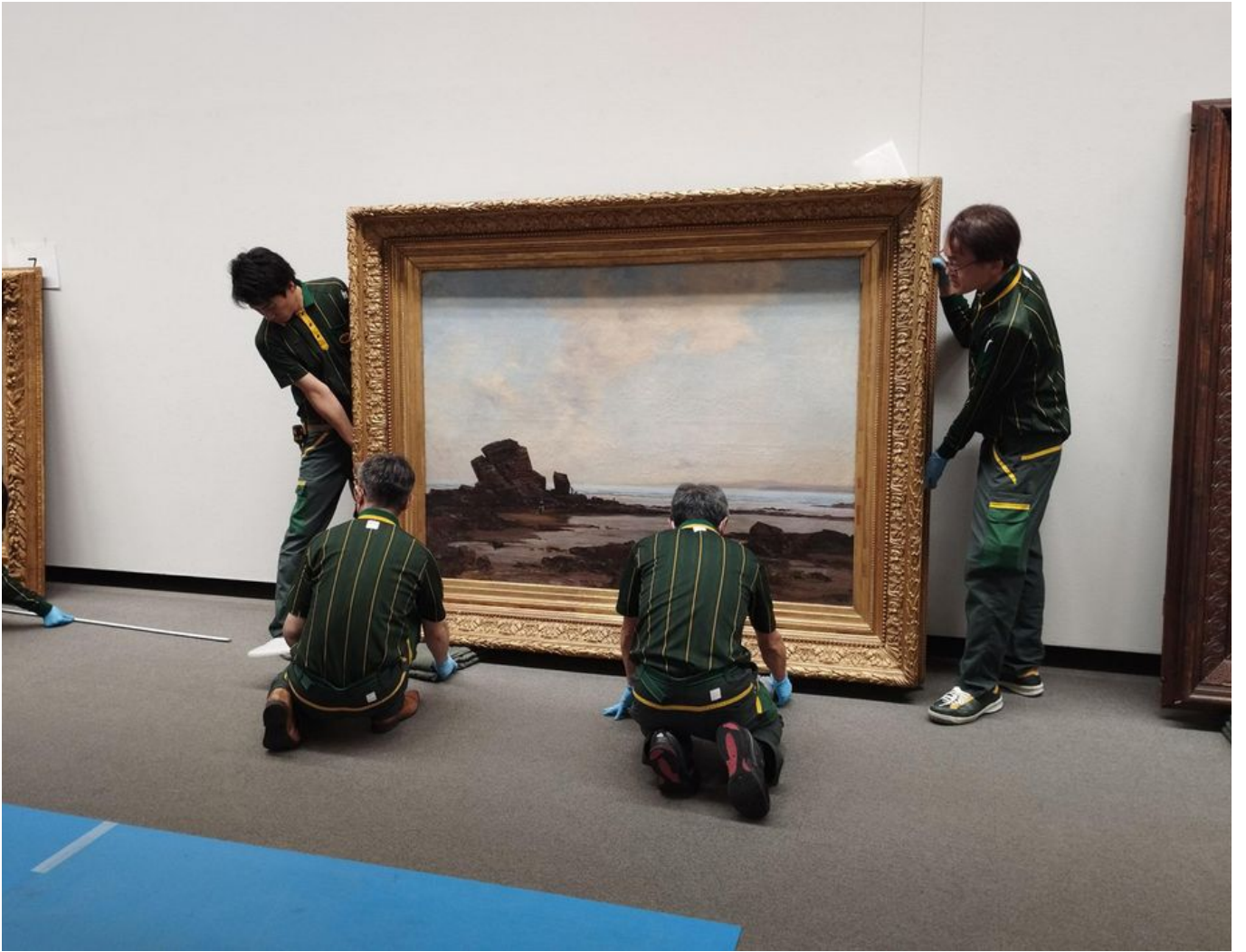
Image 3 sur 32 Accrochage à Hiroshima