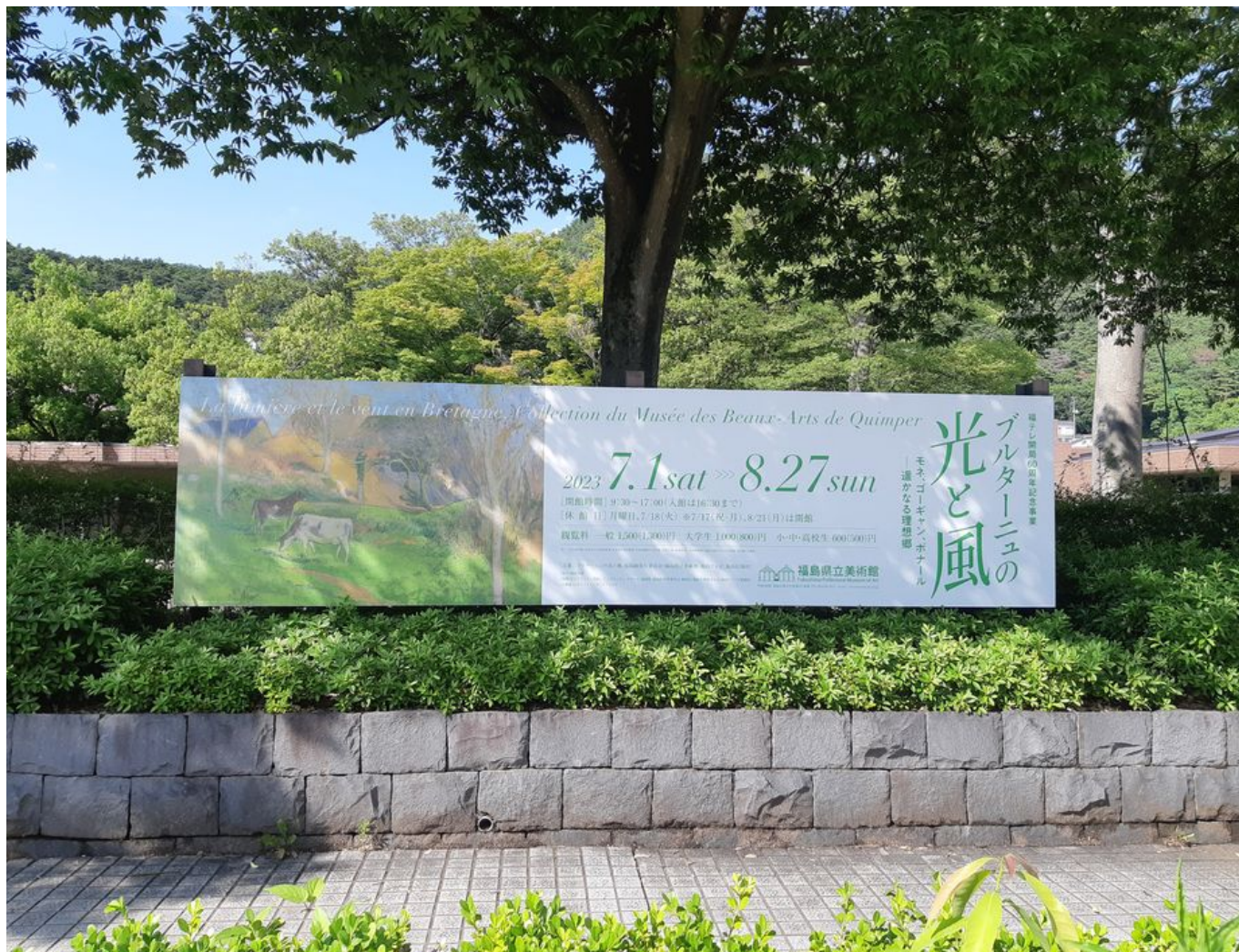
Image 18 sur 32 Affiche de l'exposition à Fukushima