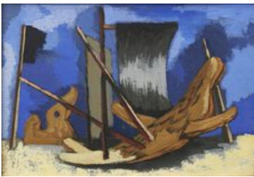
^ Jean Lurçat (1892-1966) - "Barques et mâts", non daté - Huile sur panneau, 35.5 x 24 cm - Musée des beaux-arts de Quimper