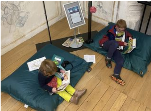
^ Salon détente et d'écoute au musée départemental breton

Testez les coussins de sol et les poufs de L'atelier d. tout en jouant ! Écoutez les commentaires sonores des chefs-d'œuvre du musée pour les identifier à l'aide des visuels présentés. RDV en salles pour voir les originaux.