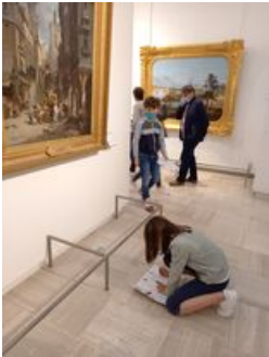
^ La Nuit des musées 2021