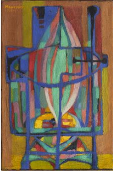
^ Alfred Manessier (1911-1993) – « La Vieillesse », 1945-1946 - Huile sur toile, 41 x 27 cm - Musée des beaux-arts de Quimper