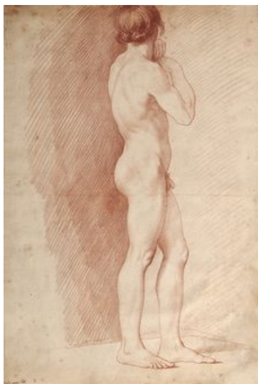
^ Edmé Bouchardon (1698-1762) - "Académie d'homme debout de dos, étude pour le génie de l'Eté", vers 1726 - Dessin à la craie brune sur papier, 61 x 41 cm - Musée des beaux-arts de Quimper