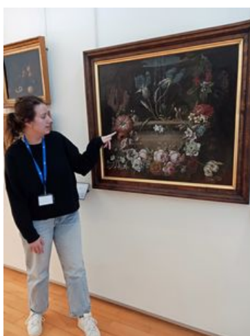
^ Visite guidée florale

De 20h15 à 23h30 en continu Départ toutes les 15 min – RDV dans le hall Sans réservation