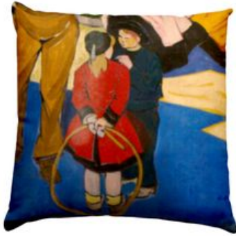
^ Coussin d'après le décor de Kermoor de Pierre de Belay

Sur Instagram, postez au cours de la soirée votre cliché le plus remarquable incluant le fauteuil géant et gagnez un coussin imprimé aux couleurs du décor de Kermoor ainsi qu'un catalogue des collections (le prix du jury et le vote du public)