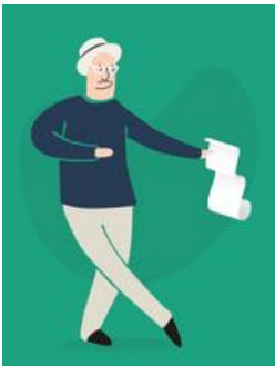
^ Joseph Bigot architecte © Traduction Graphik

Le musée des beaux-arts et le musée départemental breton offrent chaque année une enquête mémorable à nos petits Sherlock.