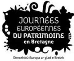
^ Logo des Journées européennes du patrimoine en Bretagne

Visite guidée "Se[a]ns interdit", la visite dont vous êtes le héros