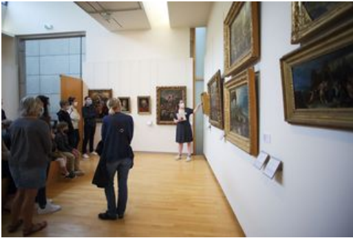
^ Visite guidée

Visite guidée "Se[a]ns interdit", la visite dont vous êtes le héros