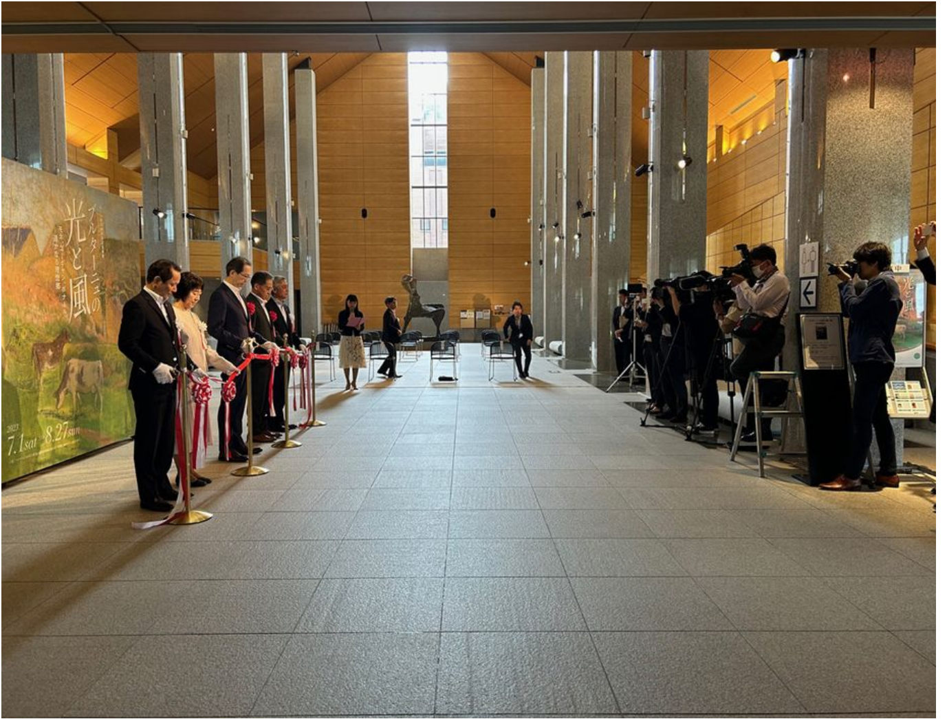
Image 20 sur 32 Inauguration de l'étape 2 de l'exposition "La lumière et le vent en Bretagne - collections du musée des beaux-arts de Quimper- au Fukushima Prefectoral Museum of Art