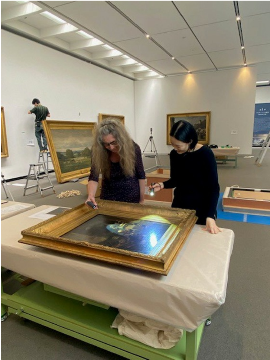
Image 4 sur 32 Constat d'état d'œuvre à Hiroshima