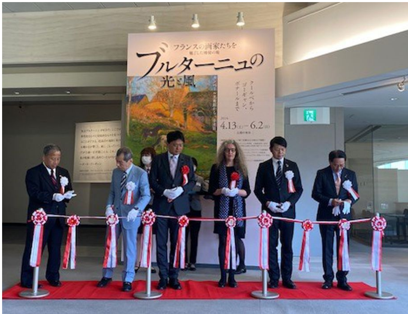
Image 7 sur 32 Inauguration à Hiroshima