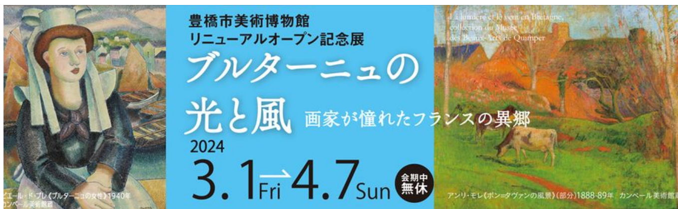
Image 8 sur 32 Bannière de l'exposition à Toyohashi