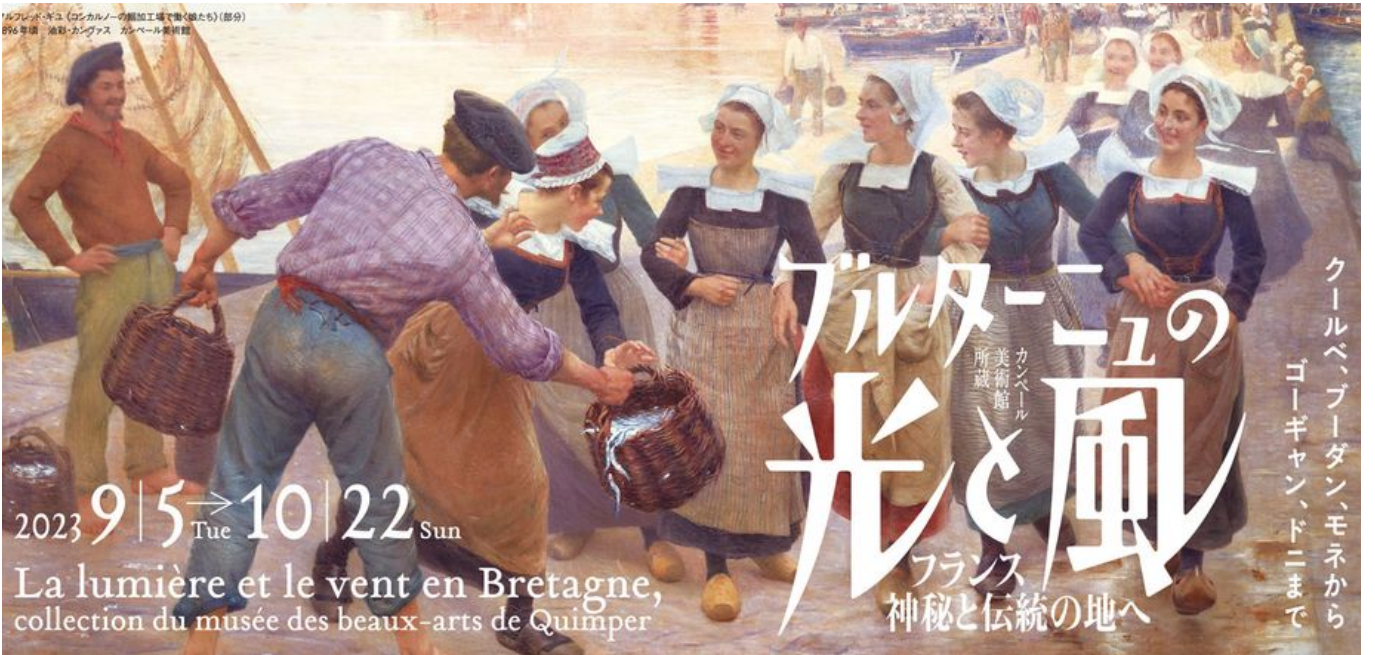
Image 17 sur 32 Affiche de l'exposition au Shizuoka City museum