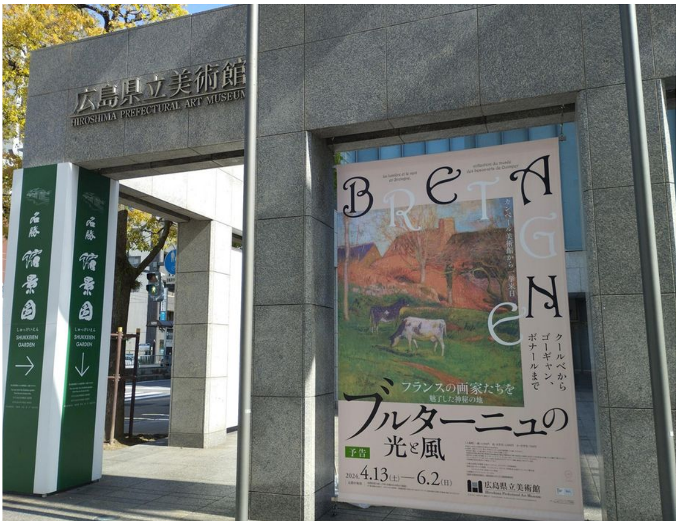
Image 1 sur 32 Affiche de l'exposition à Hiroshima