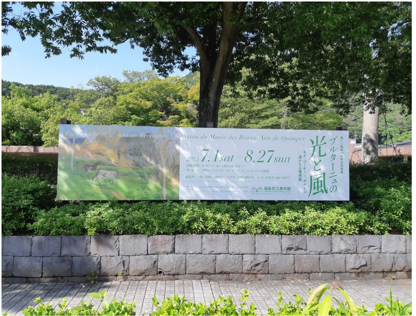
Image 18 sur 32 Affiche de l'exposition à Fukushima