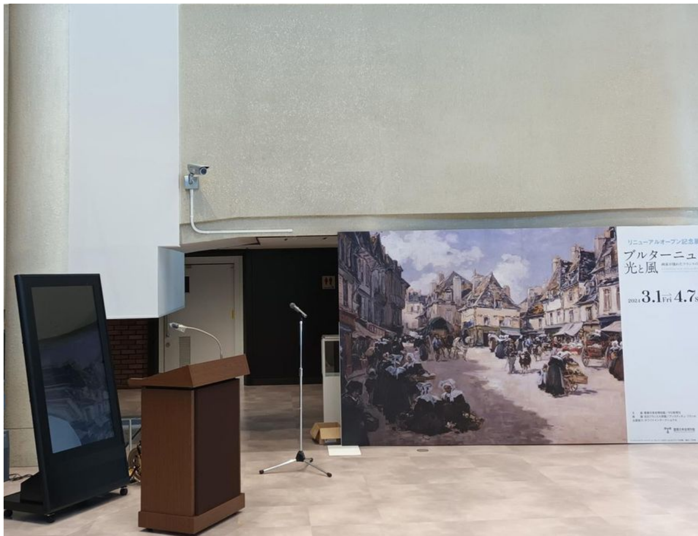
Image 11 sur 32 Préparatifs du vernissage avec l'affiche de Le Gout-Gérard