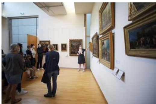
^ Visite guidée

Visite guidée "Se[a]ns interdit", la visite dont vous êtes le héros