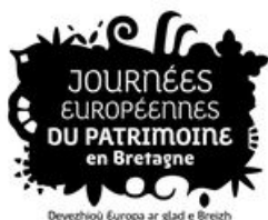
^ Logo des Journées européennes du patrimoine en Bretagne

Visite guidée "Se[a]ns interdit", la visite dont vous êtes le héros