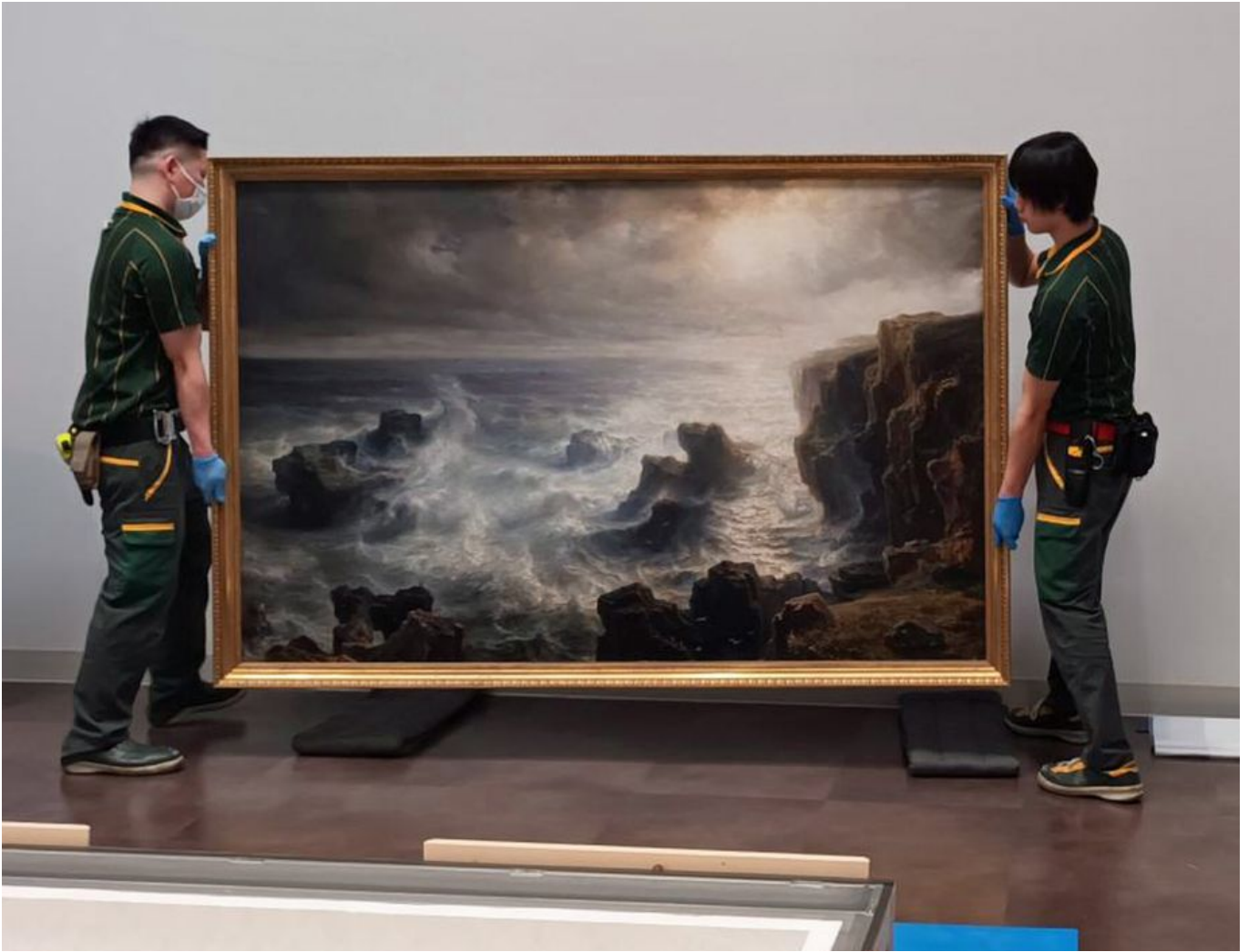
Image 16 sur 32 Accrochage du Gudin à Toyohashi