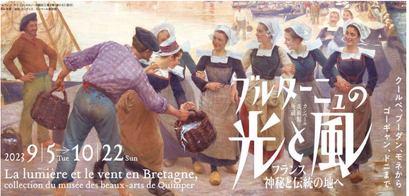
Image 17 sur 32 Affiche de l'exposition au Shizuoka City museum