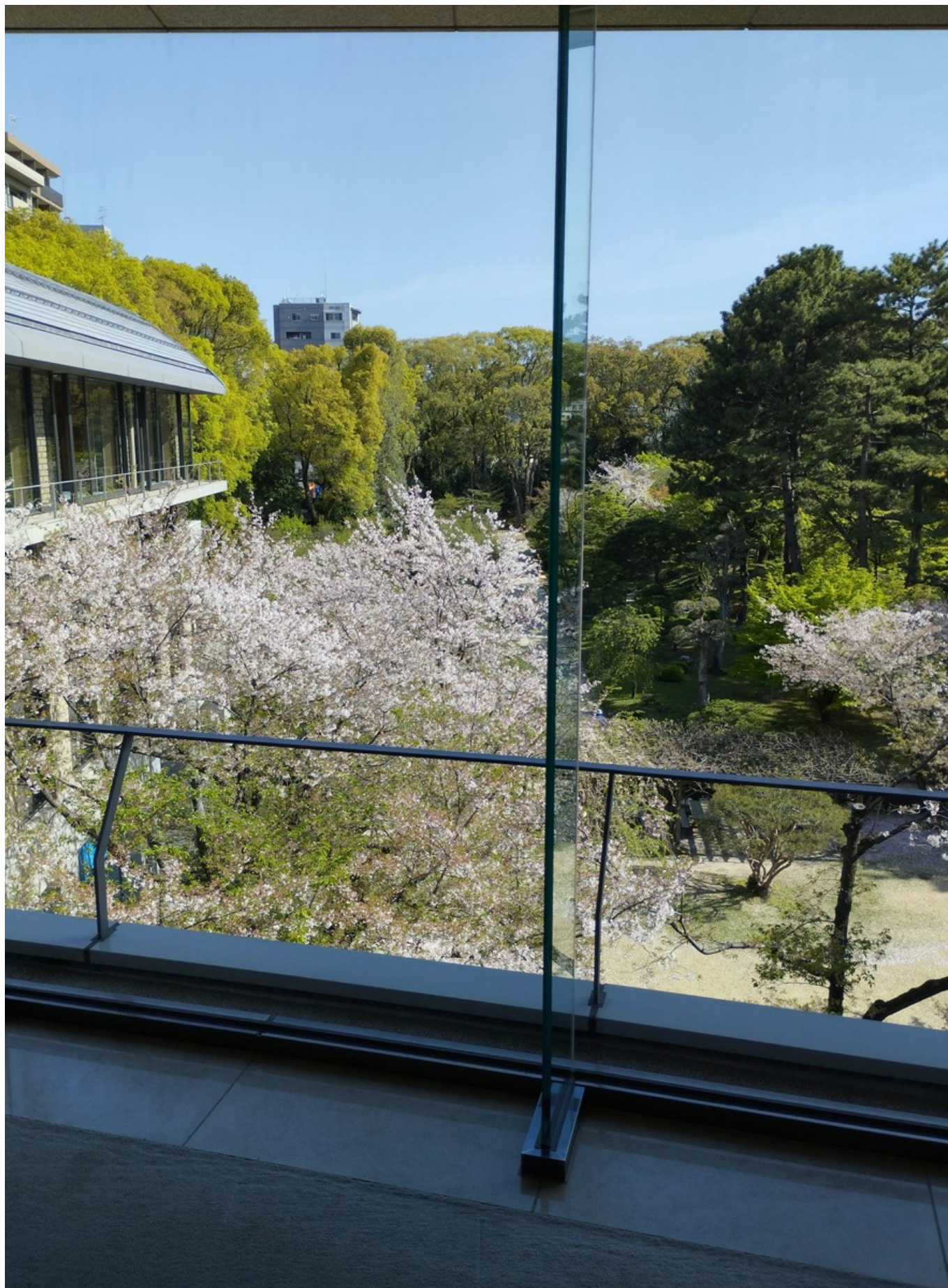
Image 2 sur 32 Le musée et son parc fleuri à Hiroshima