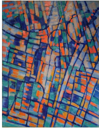
^ Jean Le Moal (1909-2007) - L'Automne, 1954 - Huile sur toile, 92 x 73 cm - Collection particulière, Paris