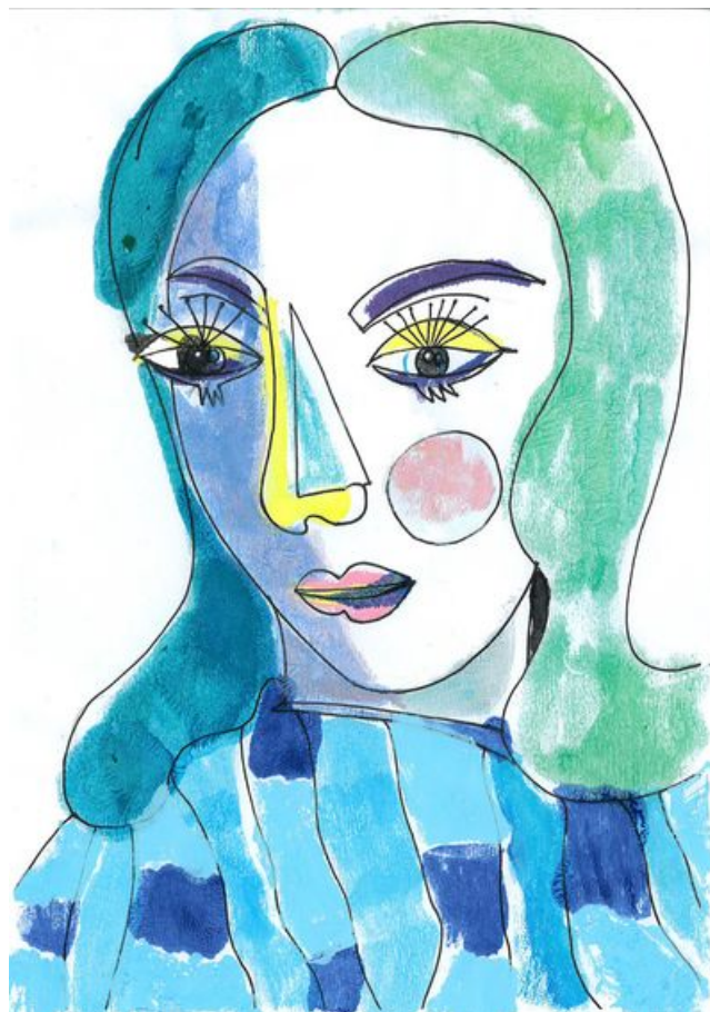
^ Résultat possible : Notre Dora pleurs bleus

◀ Activité peinture : l'aimé(e), le double, le reflet