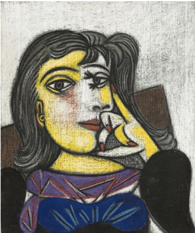
^ Pablo Picasso, Portrait de Dora Maar, 1937, huile sur toile. Musée national Picasso © RMN – Grand Palais (Musée national Picasso - Paris) / Mathieu Rabeau / Succession Picasso, 2020