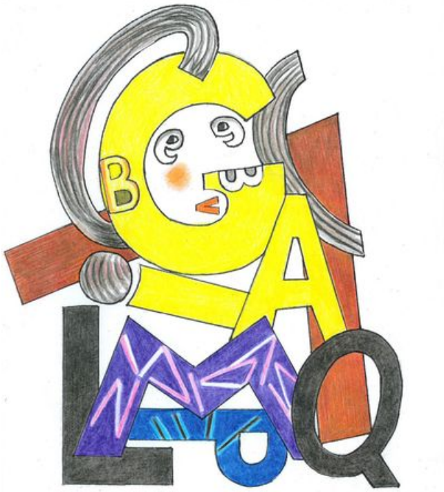
^ Résultat possible : couleurs inspirées du "Portrait de Dora Maar"