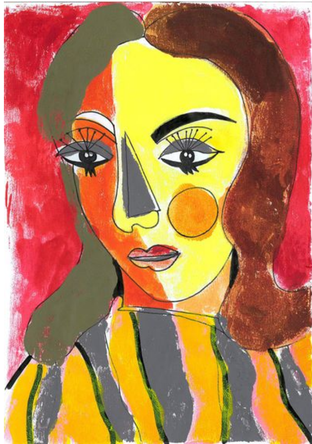
^ Résultat possible : Notre Dora façon passion amère

Astuce : repasser si besoin sur les traits imprimés au feutre pour faire ressurgir le graphisme.