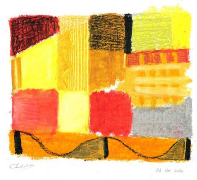
^ Essai chromatique couleurs chaudes

Gratter ou graver avec les ciseaux pour ôter de la couleur et en mettre une autre sur la partie évidée. Cela peut aussi servir à délimiter une forme.