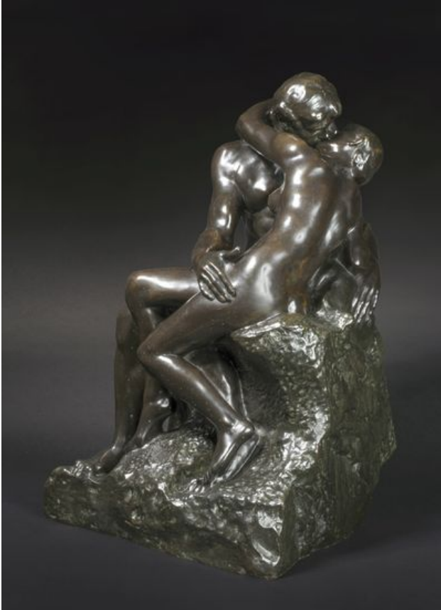
^ Auguste Rodin "La Baiser", vers 1882, fonte par Ferdinand Barbedienne vers 1898, 59 x41 x 36 cm - Guéret, musée d'Art et d'Archéologie, dépôt au musée Sainte-Croix de Poitiers