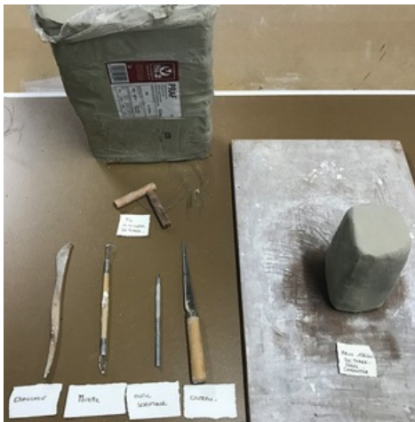
^ Matériaux nécessaires à l'atelier