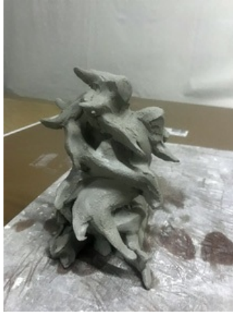
^ Modèle en terre © Elodie Cariou