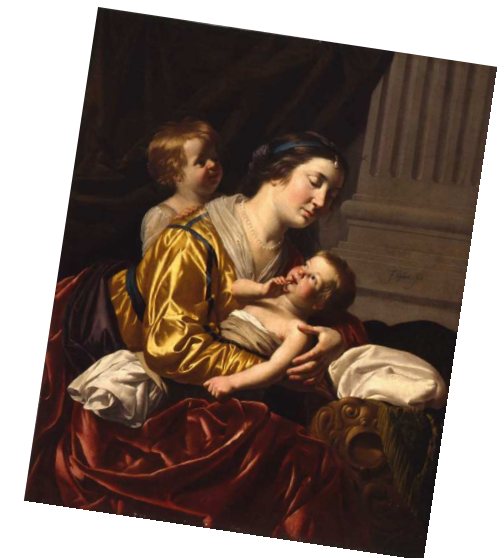
À droite : Jan Hermansz Van Bijlert (1597-1671) Femme et enfants , vers 1630