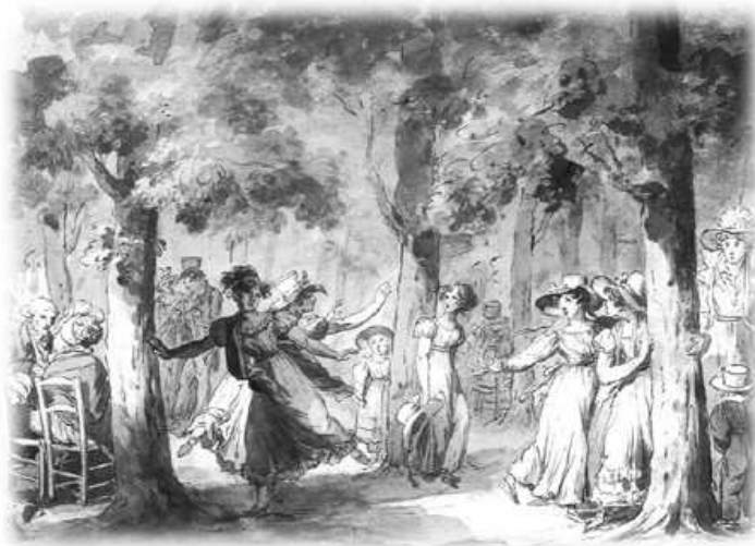
Louis-Léopold Boilly (1761-1845) Réunion dans le jardin du Luxembourg , vers 1829 Crayon et lavis brun

Trouve les différences entre le dessin et le tableau.