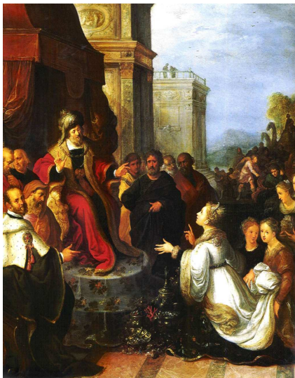
Frans Francken II (1581-1642) La Visite de la reine de Saba , 1606-1617 Peinture flamande— 1er étage—salle 4

La renommée de Salomon étant parvenue jusqu'à elle..., la reine de Saba vint l'éprouver par des énigmes. Elle apporta à Jérusalem de très grandes richesses, des chameaux chargés d'aromates, d'or en énorme quantité et des pierres précieuses.