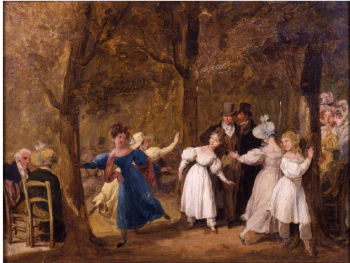
Louis-Léopold Boilly (1761-1845) Réunion dans le jardin du Luxembourg , 1829 Peinture française - 1 er étage - salle 17

Entoure la silhouette de la fillette en robe bleue.