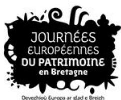
^ Logo des Journées européennes du patrimoine en Bretagne

Visite guidée "Se[a]ns interdit", la visite dont vous êtes le héros