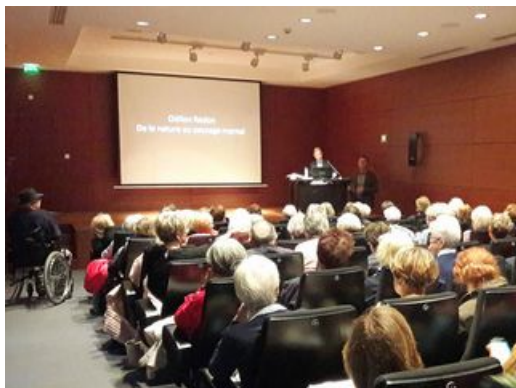
^ Conférence à la médiathèque des Ursulines