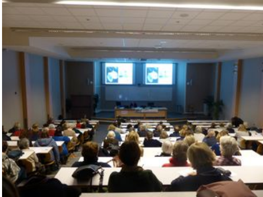
^ Conférence à l'université

Deux cycles annuels de conférences sont dispensés par l'école du Louvre à Quimper. Des conservateurs et spécialistes du sujet donnent leur conférence à partir d'images projetées.