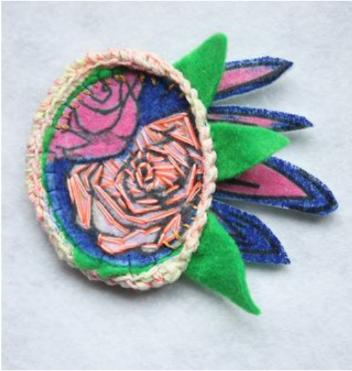
^ Modèle de broche florale proposée par Ultra Editions © Mona Luison