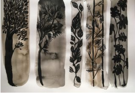
^ Modèle de l'atelier "Exploration végétale"