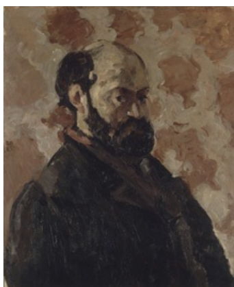
Image 4 sur 7 Paul Cézanne (1839-1906) - Portrait de l'artiste au fond rose, vers 1875 - Musée d'Orsay, Paris