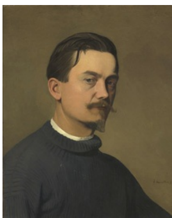
Image 3 sur 7 Félix Vallotton (1865-1925) - Autoportrait - Musée d'Orsay, Paris