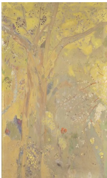
Image 3 sur 5 Redon Odilon (1840-1916), Paris, musée d'Orsay. RF1988-30.