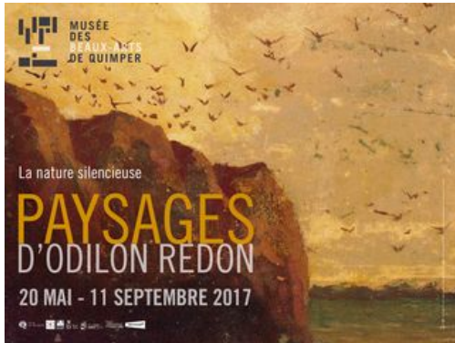
^ Affiche de l'exposition Odilon Redon