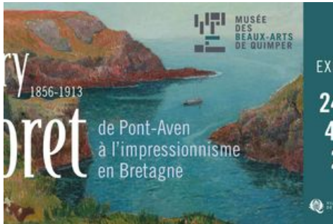
Henry Moret (1856-1913), De Pont-Aven à l'Impressionnisme en Bretagne