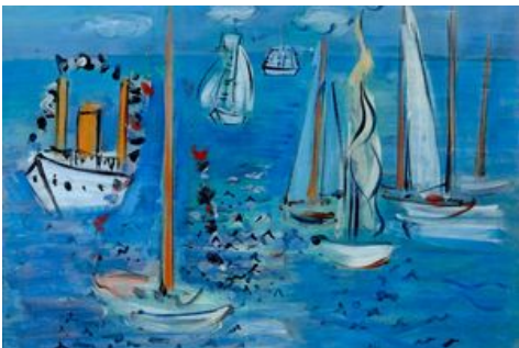
Raoul Dufy (1877-1953), Les Années folles