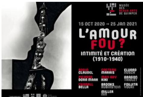
L'Amour fou ? Intimité et création (1910-1940)