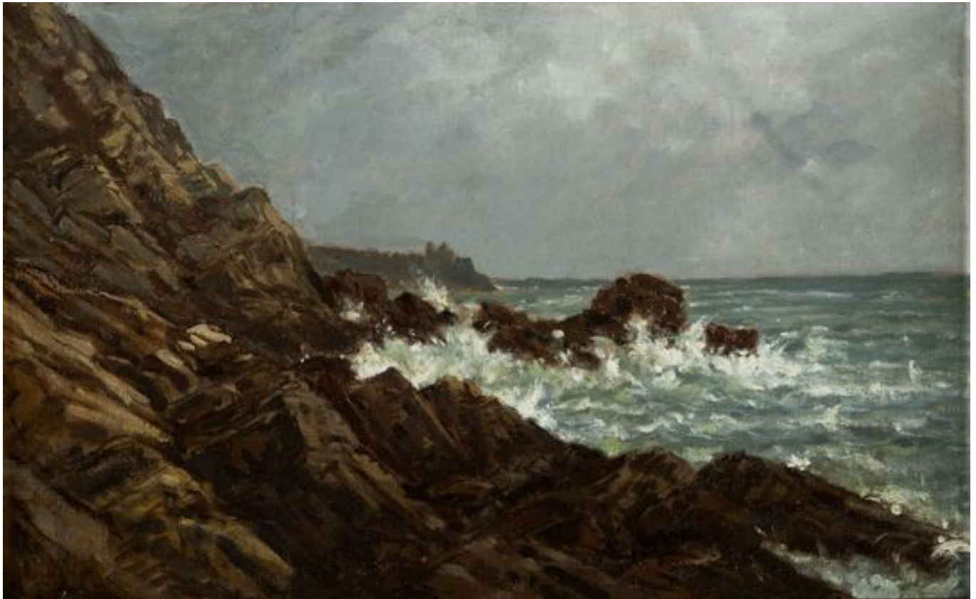
Auguste Anastasi (Paris, 1820-id. 1889) - "La Côte près de Pont-Aven", vers 1869 - Huile sur toile, 25 x 39 cm - Musée des beaux-arts de Quimper