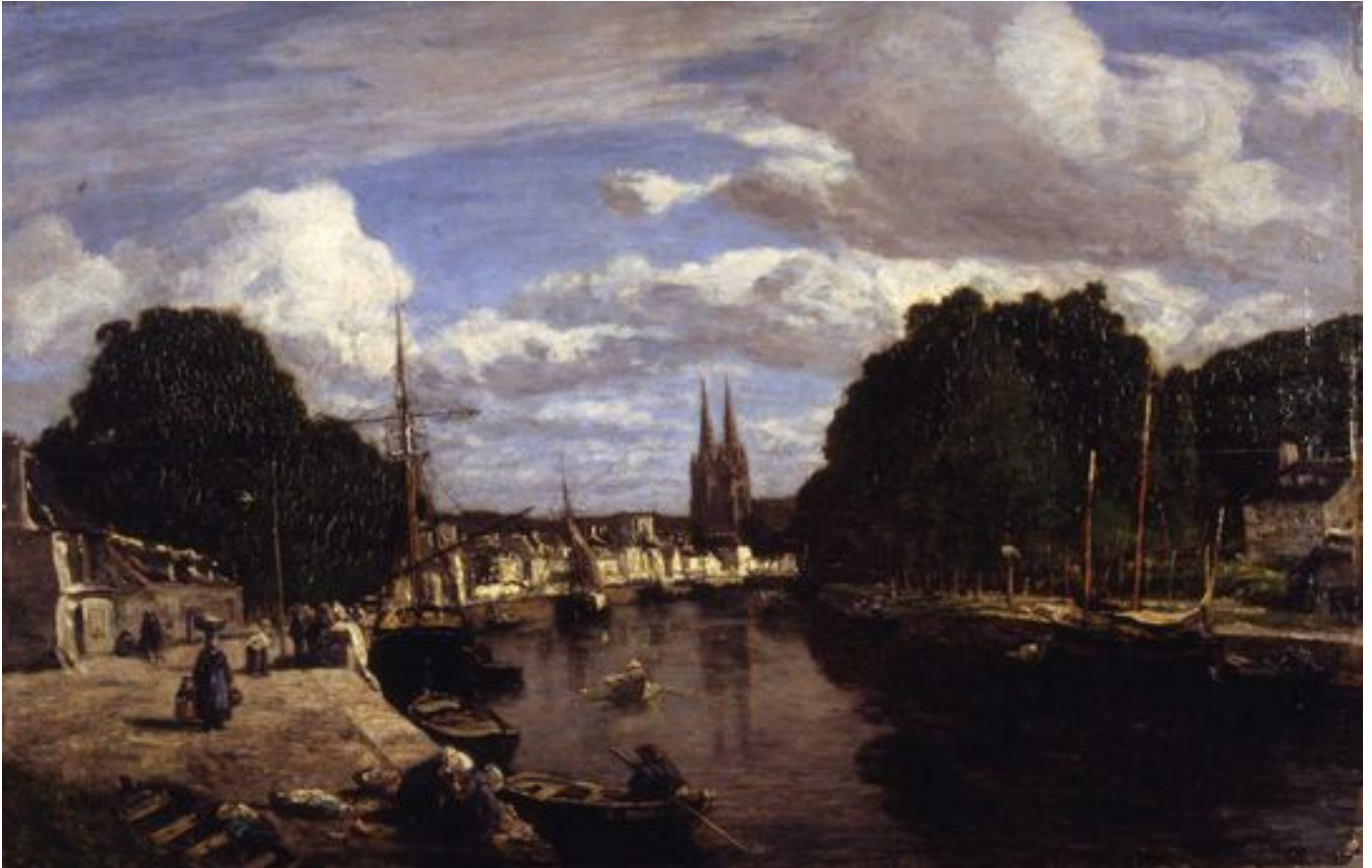
Eugène Boudin (1824-1898) - Vue du port de Quimper, 1857 - Huile sur bois, 40 x 62 cm - Musée des beaux-arts de Quimper