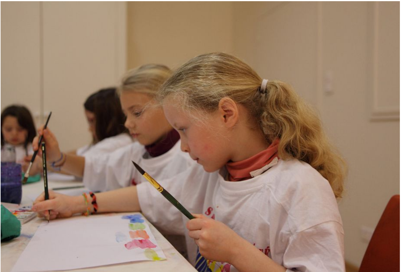
Image 6 sur 8 Les artistes en herbe