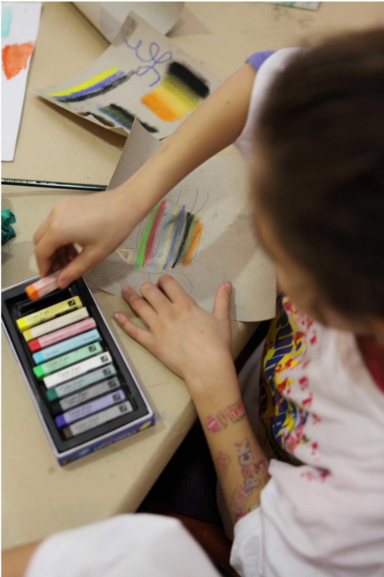
Image 4 sur 8 Atelier d'arts plastiques pour les enfants