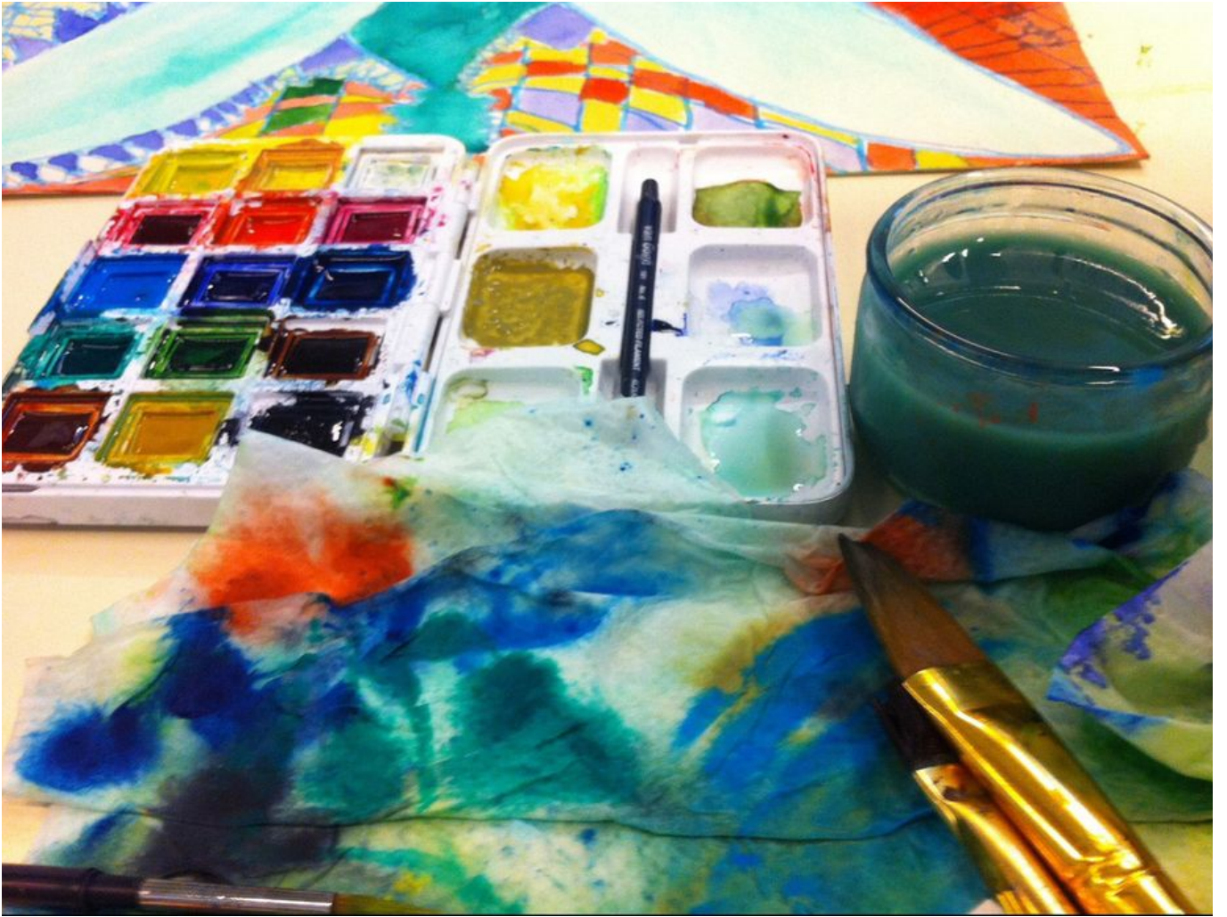
Image 2 sur 8 Atelier d'arts plastiques