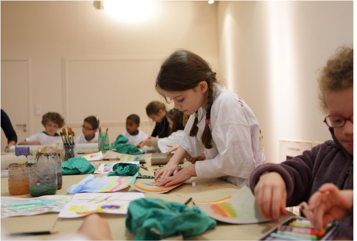
Image 5 sur 8 Les artistes en herbe