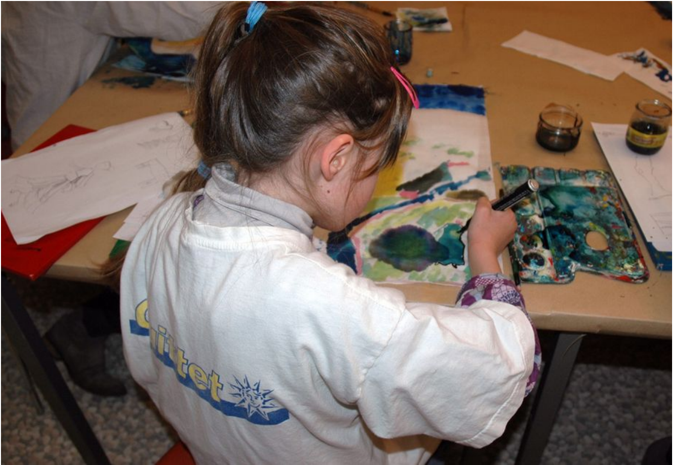
Image 3 sur 8 Atelier d'arts plastiques pour enfants "Les artistes en herbe"