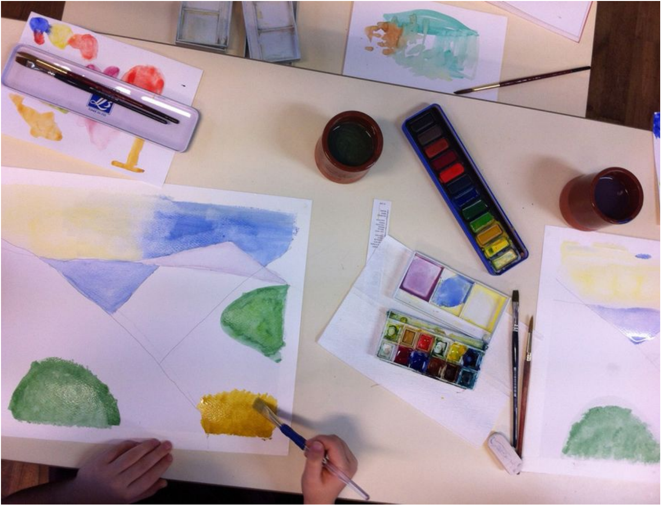
Image 7 sur 8 Les artistes en herbe