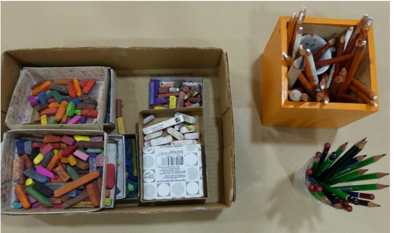
Image 8 sur 8 Atelier d'arts plastiques