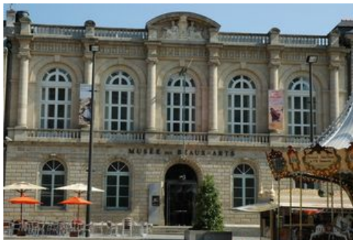
^ Façade du musée

Stationnement limitrophe sur la place Saint-Corentin