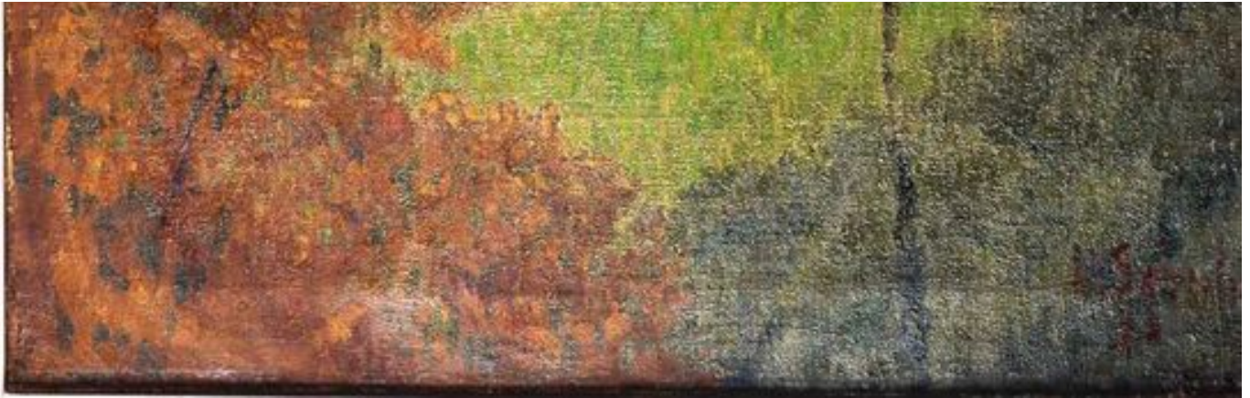
Paul Sérusier (1864-1927) Paysage ogival, 1821, huile sur toile, 106 x 65,8 cm