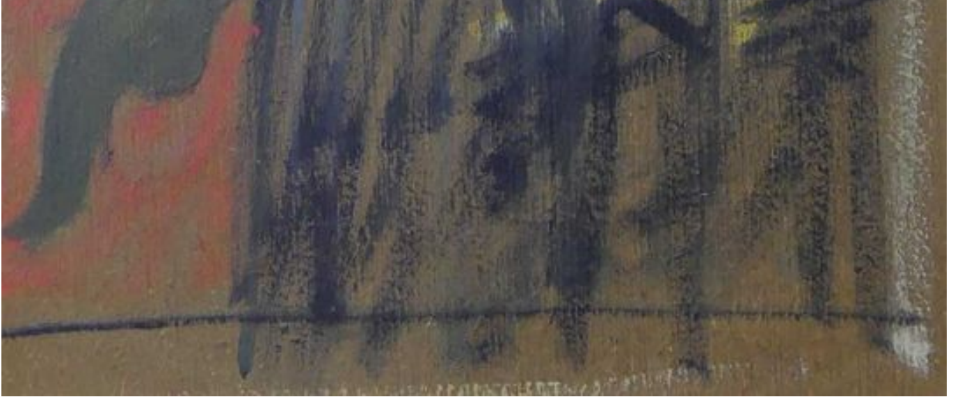
Paul Sérusier (1864-1927) Vieille Bretonne, vers 1891-1893, tempera sur papier cartonné, 40,5 x 24,5 cm