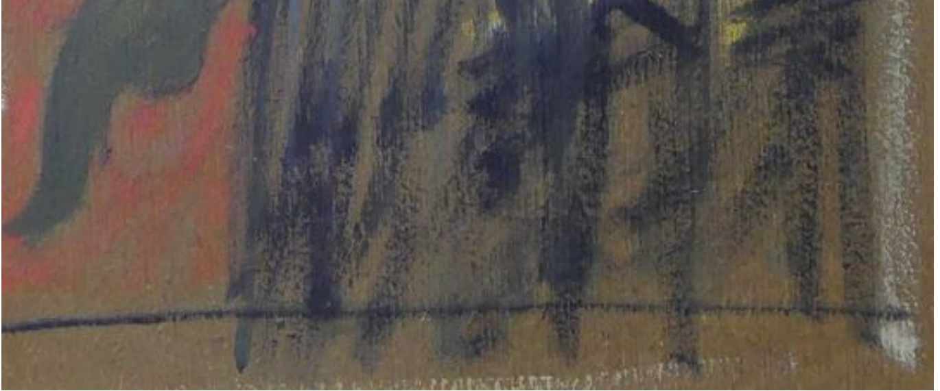
Paul Sérusier (1864-1927) Vieille Bretonne, vers 1891-1893, tempéra sur papier cartonné, 40,5 x 24,5 cm