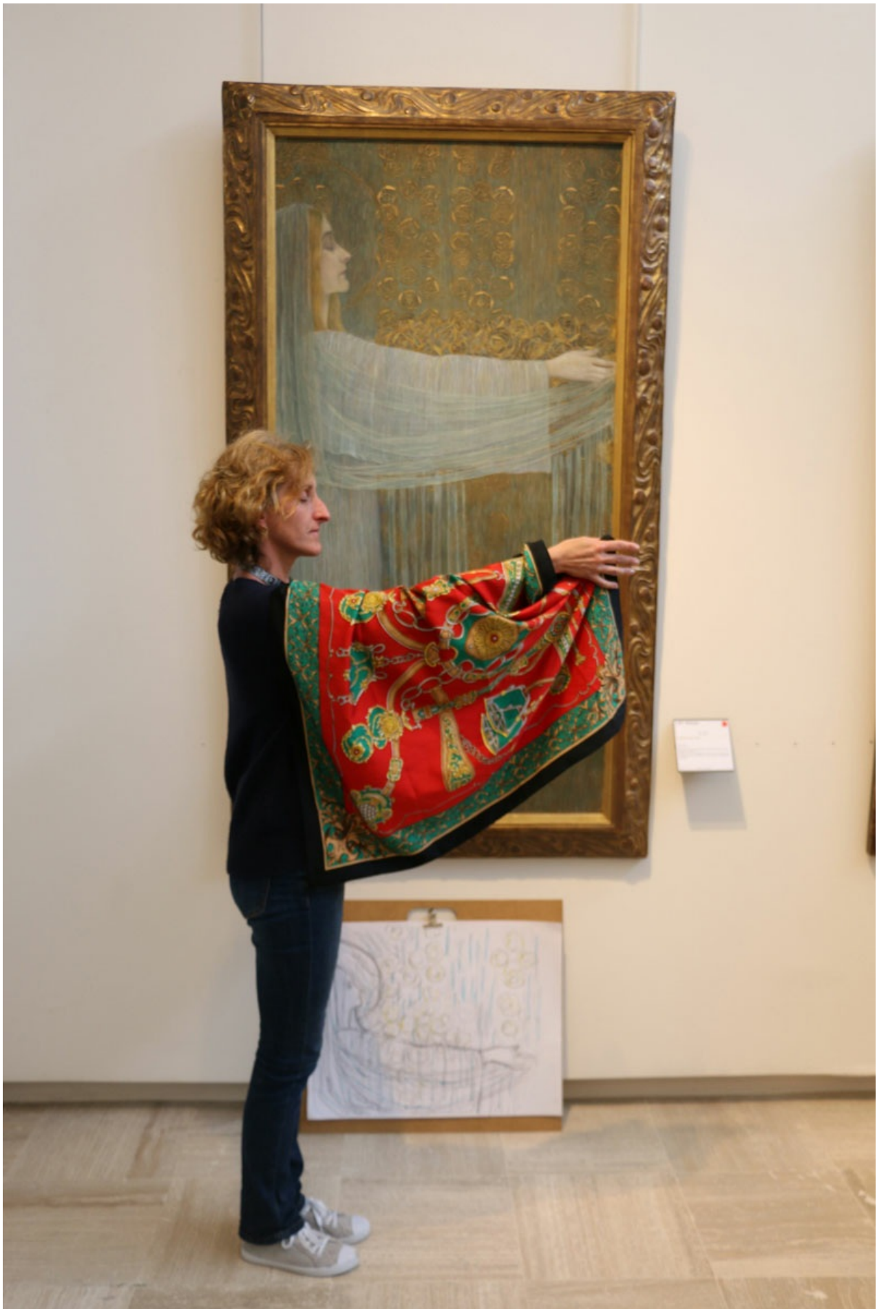
Image 23 sur 92 Le Miracle des roses