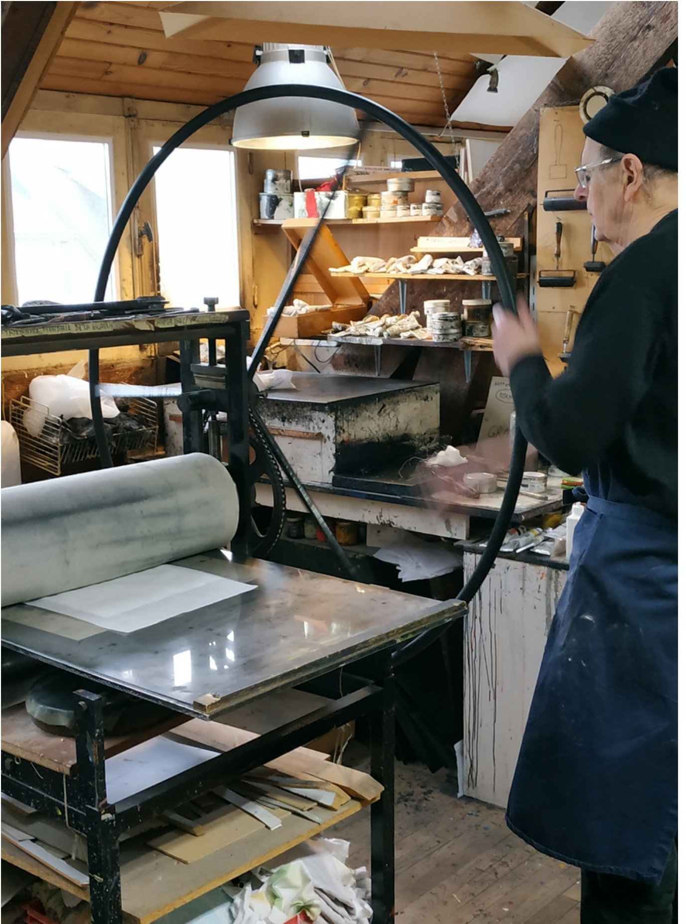
Image 6 sur 7 Passage de la matrice en presse