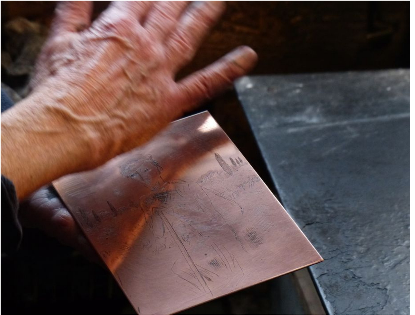
Image 5 sur 7 Essuyage de la plaque encrée à la paume de la main