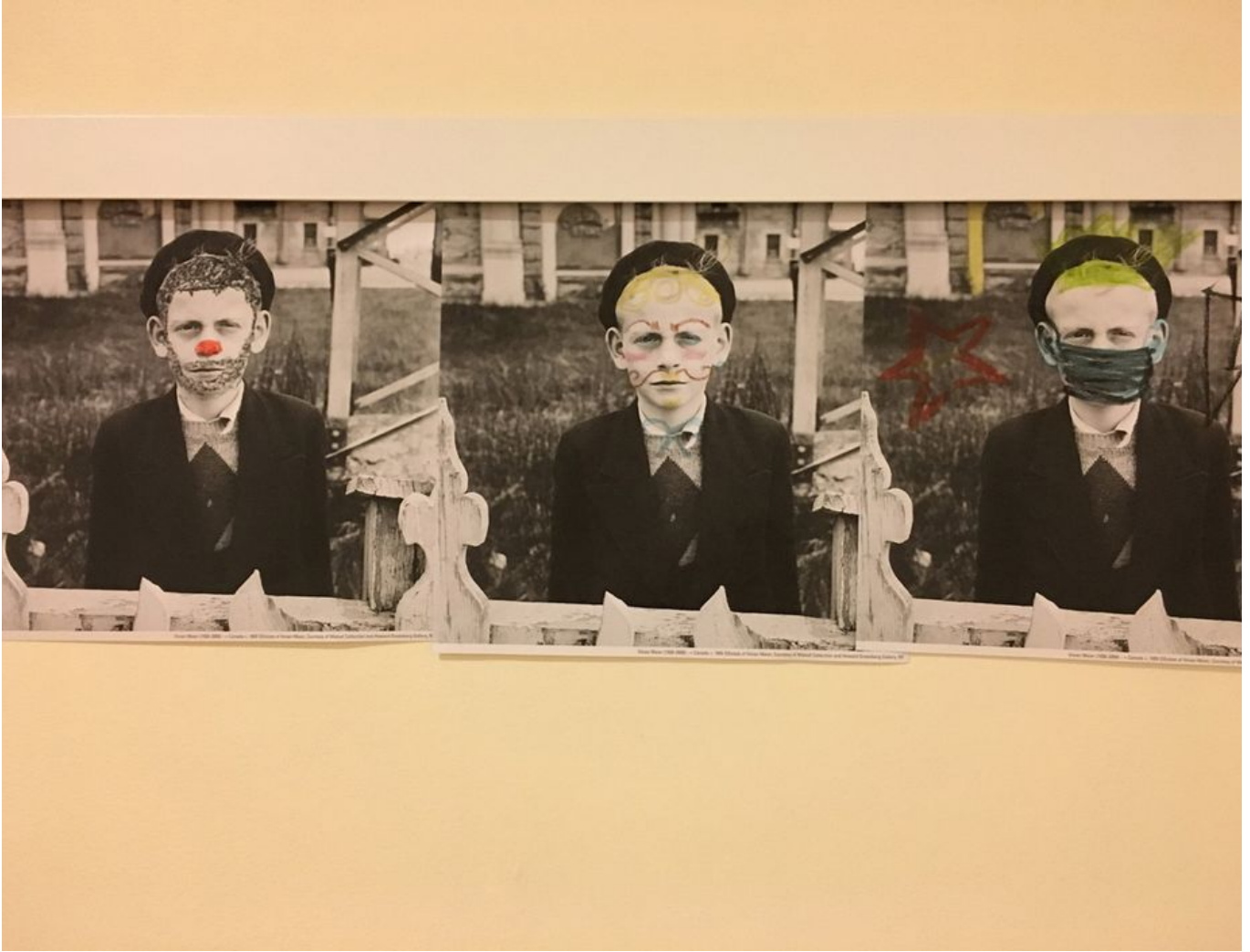
Image 10 sur 10 Salle jeune public "Secrets d'atelier : objectif Vivian Maier" : exemples de coloriages