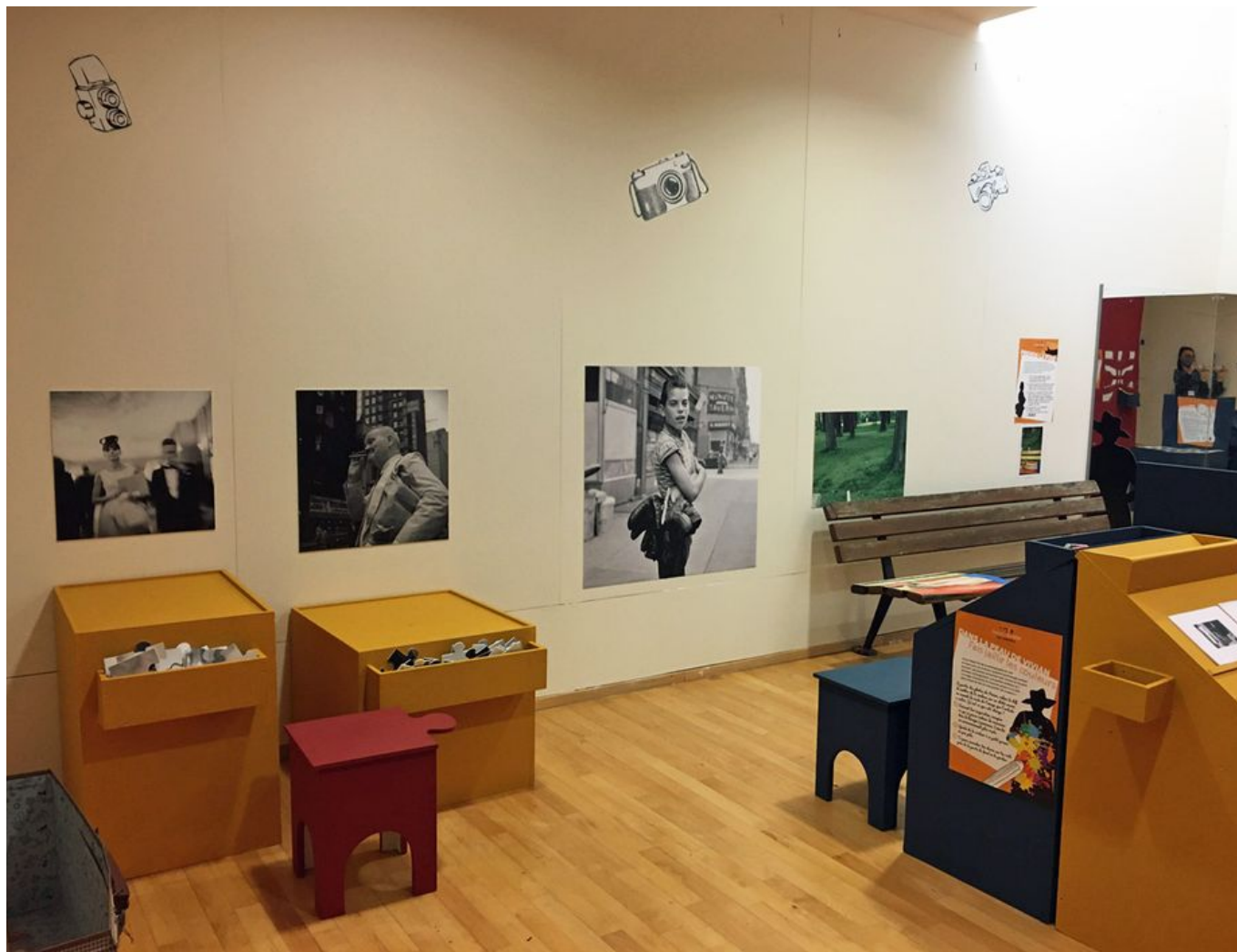
Image 2 sur 10 Vue d'ensemble de la salle jeune public "Secrets d'atelier : objectif Vivian Maier"