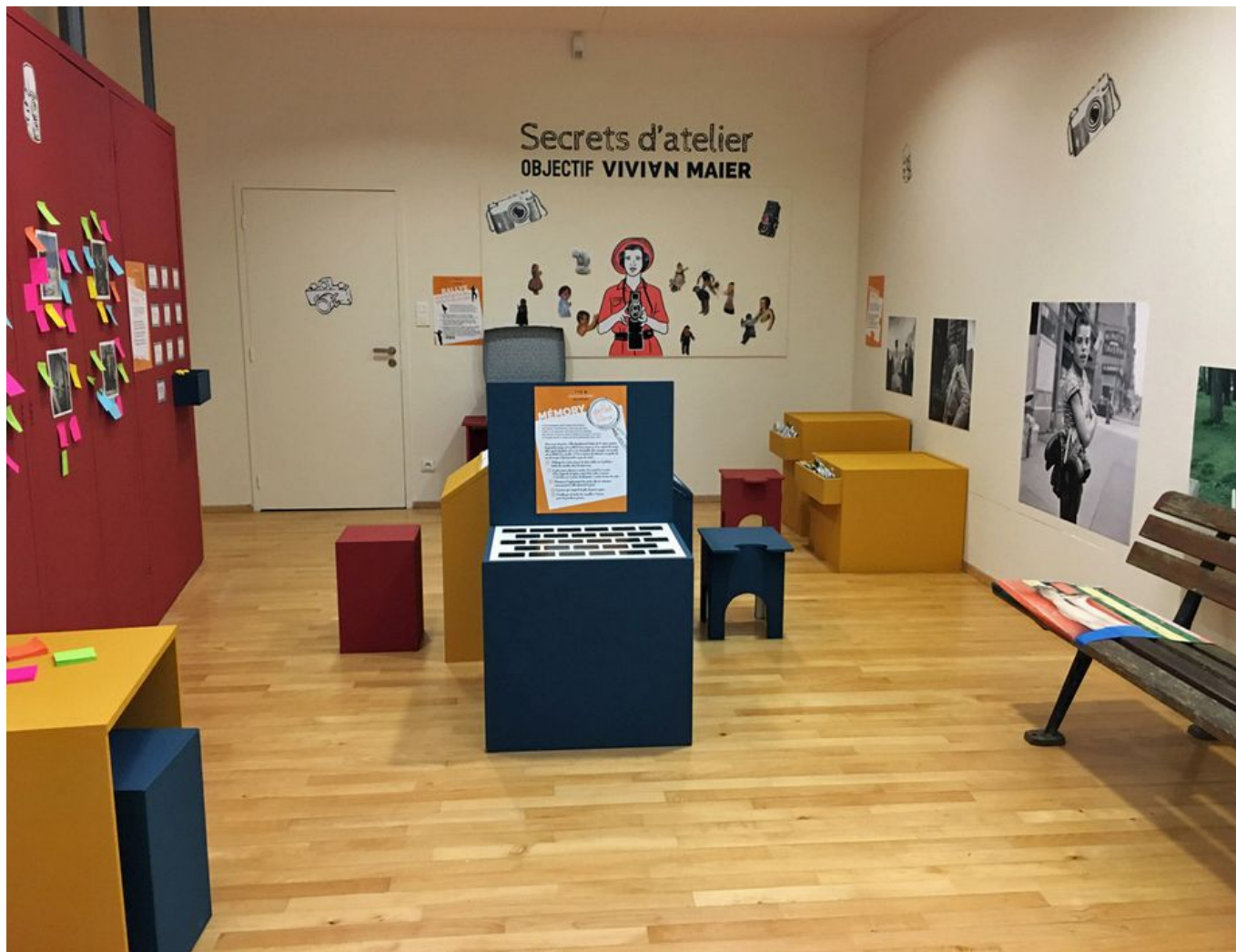
Image 1 sur 10 Vue d'ensemble de la salle jeune public "Secrets d'atelier : objectif Vivian Maier"