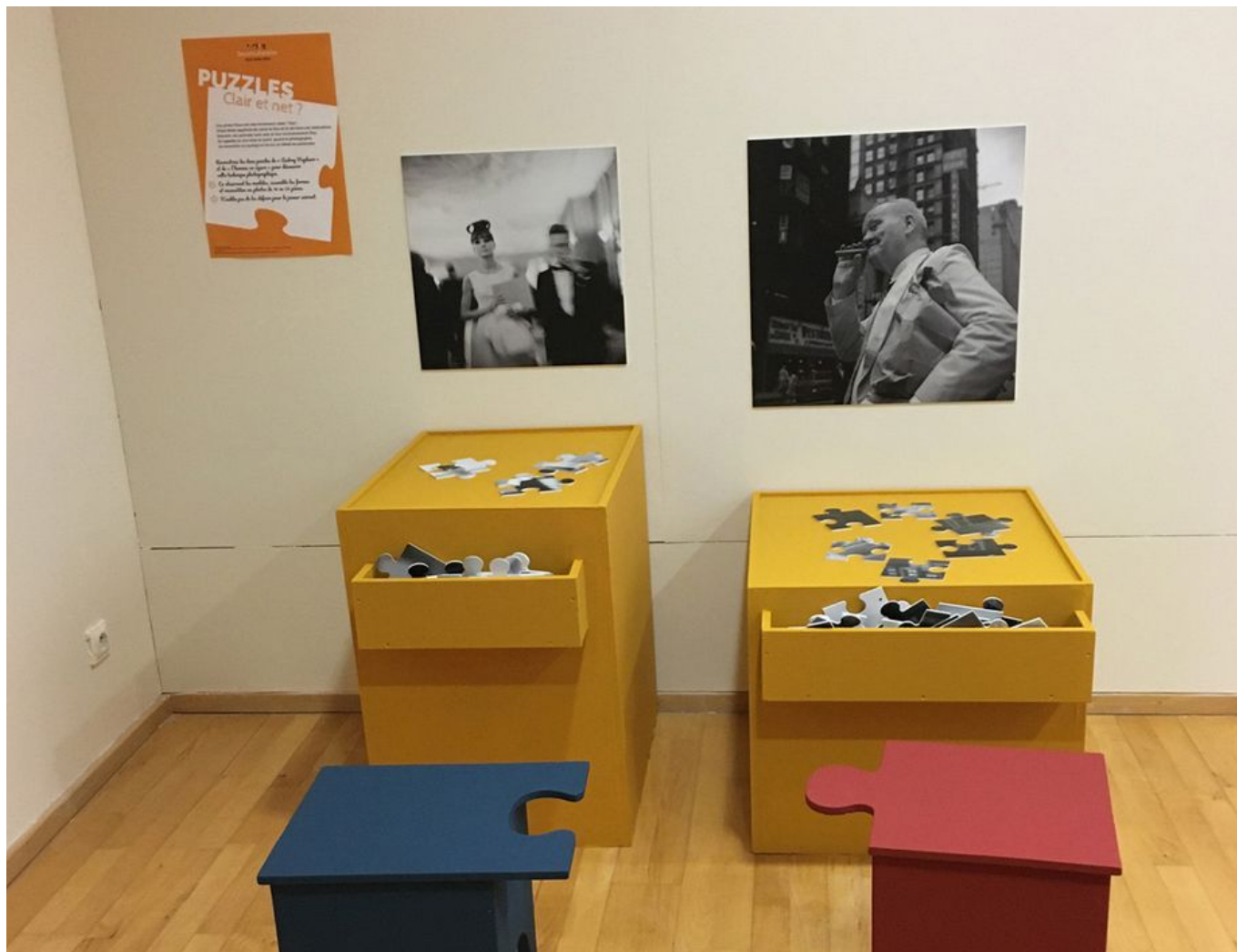
Image 3 sur 10 Salle jeune public "Secrets d'atelier : objectif Vivian Maier" : les puzzles