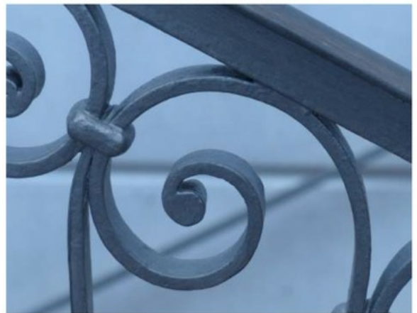
Image 9 sur 10 Salle jeune public "Secrets d'atelier : objectif Vivian Maier" : extrait du memory