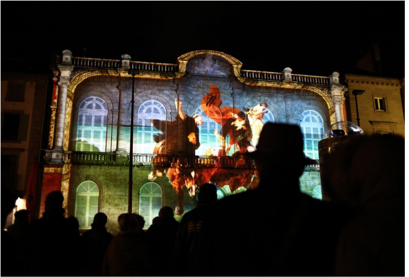
Image 4 sur 5 Façade du musée illuminée pour Noël 2019