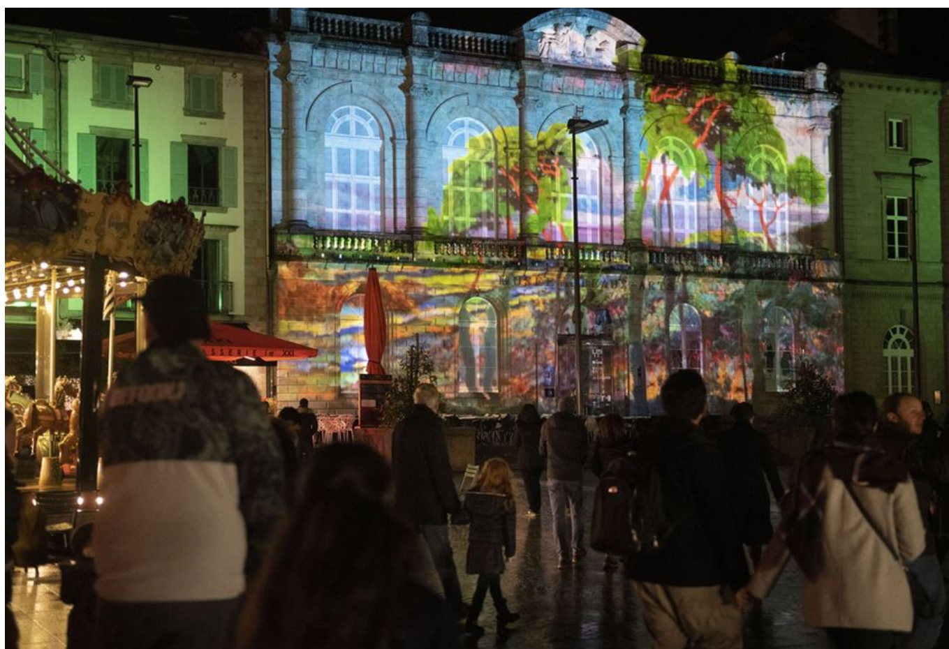
Image 3 sur 5 Façade du musée illuminée pour Noël 2019