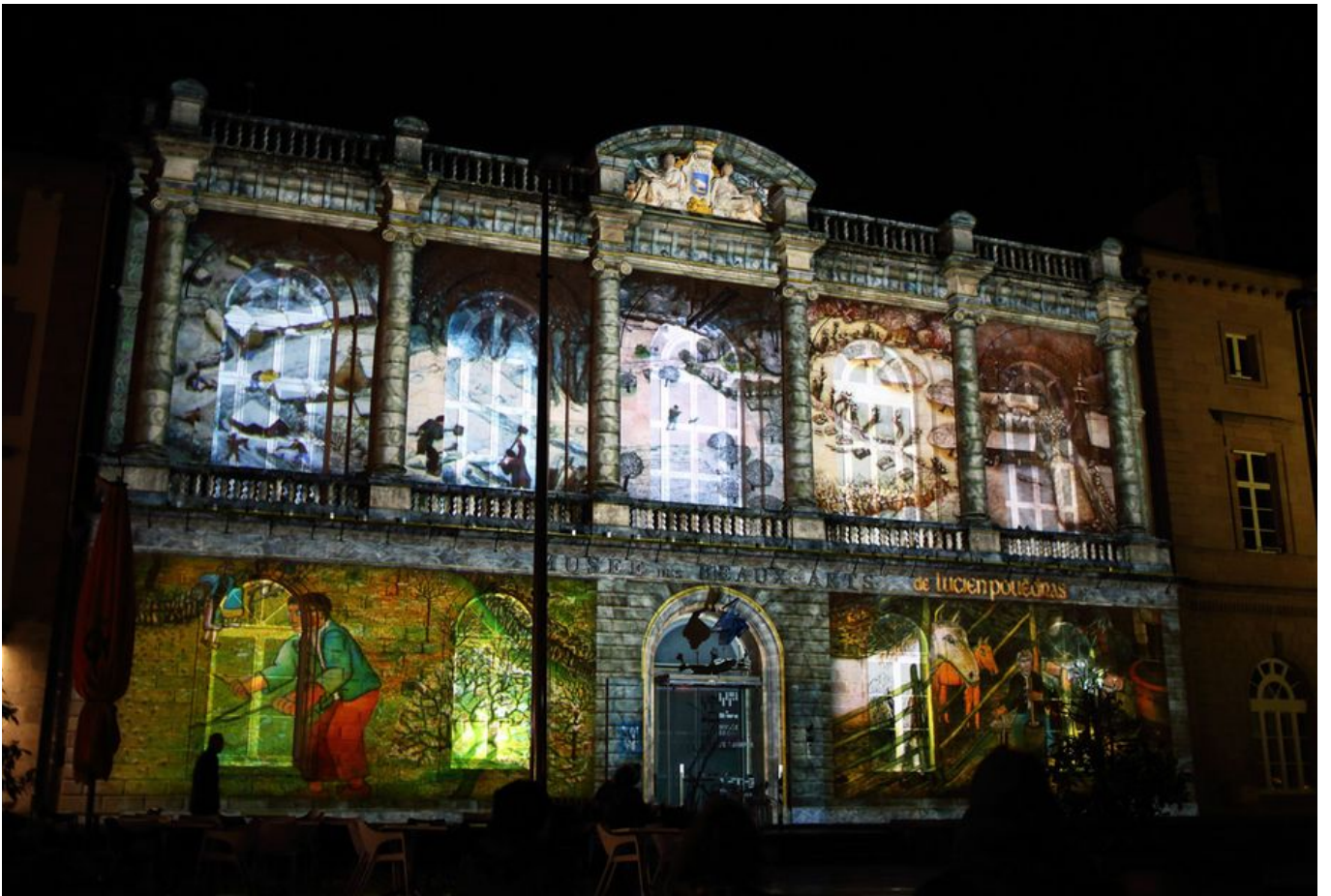
Image 5 sur 5 Façade du musée illuminée pour Noël 2019